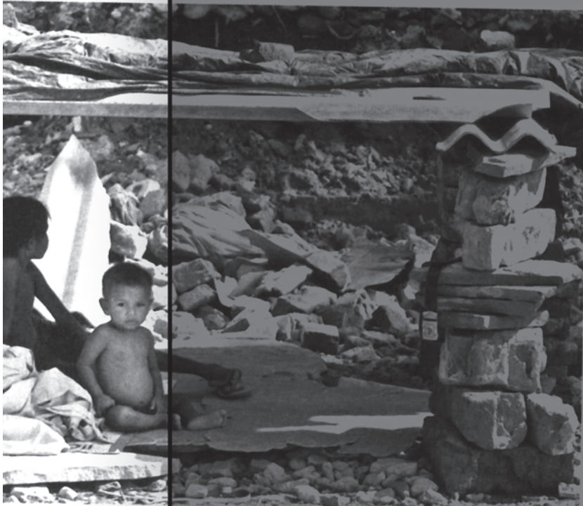
in their demolished house, in New Delhi on July 31.

tries and State these funds must invariably certifying the dates be transferred to panchayats amounts of local gran