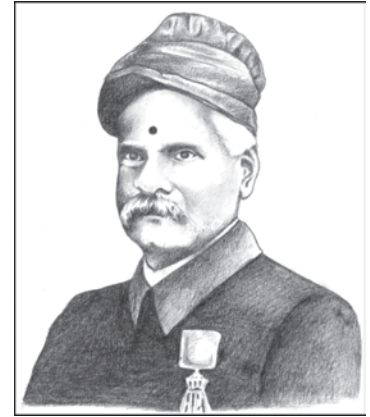
राजा रवि वर्मा

की नवीन प्रविधियों की उपस्थिति मिलती है जो कि तैलीय चित्र के रूप में व्यक्त होती है..... इसकी अन्य विशेषता है स्थानों के वितरण करने की प्रविधि जैसे उम्र और स्तरीकरण के अनुसार बैठे हुए व्यक्तियों की व्यवस्था, उससे 19वीं सदी के उन यूरोपीय चित्रों की याद आती है जिसमें बुर्जुवा परिवार दिखाए गए हैं। कितने आश्चर्य की बात है कि ये पेंटिंग मातृवंशीय केरल के नायकों की हैं जो कि कृष्णा मेनन की जाति थी, उस वक्त बनायी गई थीं जब वे पितृस्थानीय एकल परिवार से ज्यादा परिचित भी नहीं थे.....”