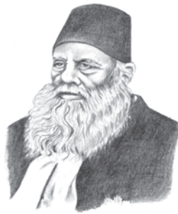
सर सैयद अहमद खाँ

आप जान चुके हैं कि उपनिवेशवाद ने हमारे जीवन पर दूरगामी प्रभाव डाले। उन्नीसवीं सदी में हुए समाज सुधार आंदोलन उन चुनौतियों के जवाब थे जिन्हें औपनिवेशिक भारत महसूस कर रहा था। आप संभवतः उन सभी सामाजिक पहलुओं से अवगत हों जिन्हें भारतीय समाज में सामाजिक कुरीति माना जाता था। उन सामाजिक कुरीतियों से भारतीय समाज बुरी तरह से ग्रस्त