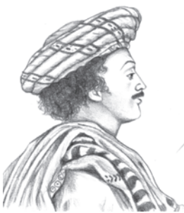
राजा राम मोहन राय