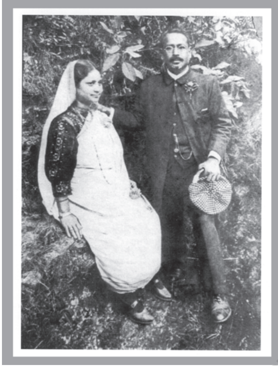
आधुनिकता एवं परंपरा का मिश्रण