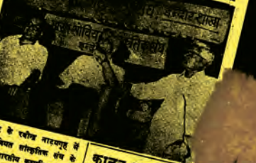
शहर के रवींद्र नाट्यमंडल में भारत-नीतिवादी लोकगीतों के कार्यक्रम का आयोजन हुआ।

CHIEF SUBS/SUBS Message to Chief Sub, Bombay/Ahmedabad, from Chief Sub, Delhi. The censor rang up to say that the Prime Minister's interview to the correspondent of the "Daily Telegraph" should be sent to him before publication. September 28, 1976