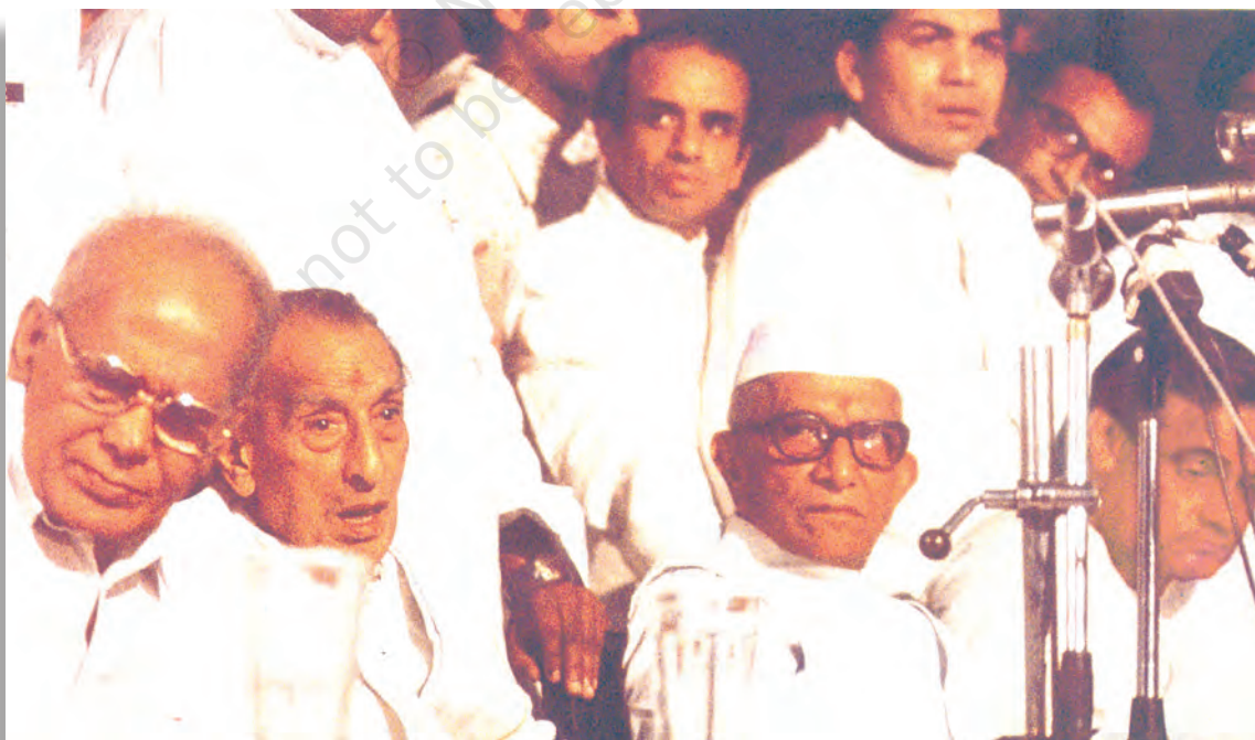
1977 में बनी गैर-कांग्रेसी सरकार का शपथ ग्रहण समारोह। चित्र में जयप्रकाश नारायण, जे. बी. कृपलानी, मोरारजी देसाई और अटलबिहारी वाजपेयी बैठे हुए नज़र आ रहे हैं।

बहरहाल अगर आप चुनावी नतीजों के नक्शे पर नज़र दौड़ाएँ, तो पाएँगे कि कांग्रेस देश में हर जगह चुनाव नहीं हारी थी। महाराष्ट्र, गुजरात और उड़ीसा में उसने कई सीटों पर अपना कब्ज़ा बरकरार रखा था और दक्षिण भारत के राज्यों में तो एक तरह से उसकी चुनावी विजय का चक्का बेरोक-टोक चला था। इसके कई कारण रहे। पहली बात तो यह थी कि आपातकाल का प्रभाव हर राज्य पर एकसमान नहीं पड़ा था। लोगों को ज़बरन उजाड़ने और विस्थापित करने अथवा ज़बरन नसबंदी करने का काम ज़्यादातर उत्तर भारत के राज्यों में हुआ था, लेकिन इससे भी ज़्यादा महत्वपूर्ण बात यह थी कि उत्तर भारत में राजनीतिक प्रतिद्वंद्विता की प्रकृति में दूरगामी बदलाव आए थे। उत्तर भारत का मध्यवर्ग कांग्रेस से दूर जाने लगा था