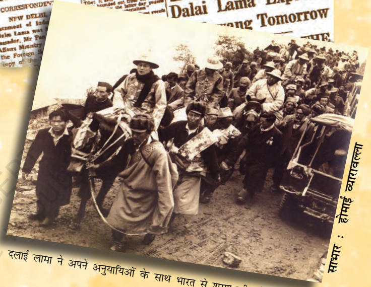
दलाई लामा ने अपने अनुयायियों के साथ भारत से शरण की माँग की।

चीन ने 'स्वायत्त तिब्बत क्षेत्र' बनाया है और इस इलाके को वह चीन का अभिन्न अंग मानता है। तिब्बती जनता चीन के इस दावे को नहीं मानती कि तिब्बत चीन का अभिन्न अंग है। ज्यादा से ज्यादा संख्या में चीनी बाशिंदों को तिब्बत लाकर वहाँ बसाने की चीन की नीति का तिब्बती जनता ने विरोध किया। तिब्बती चीन के इस दावे को भी नकारते हैं कि तिब्बत को स्वायत्तता दी गई है। वे मानते हैं कि तिब्बत की पारंपरिक संस्कृति और धर्म को नष्ट करके चीन वहाँ साम्यवाद फैलाना चाहता है।