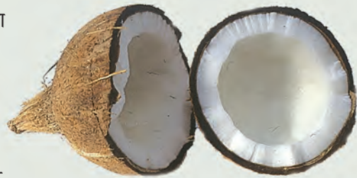
चित्र 5.1 (ख) नारियल

इस अध्याय में हम यह देखेंगे कि उपमहाद्वीप में आए यात्रियों द्वारा दिए गए सामाजिक जीवन के विवरणों के अध्ययन से किस प्रकार हम अपने अतीत के विषय में ज्ञान बढ़ा सकते हैं। इसके लिए हम तीन व्यक्तियों के वृत्तांतों पर ध्यान देंगे: अल-बिरूनी, जो ग्यारहवीं शताब्दी में उज्बेकिस्तान आया था, इब्न बतूता (चौदहवीं शताब्दी), मोरक्को से तथा फ्रांसीसी यात्री फ्रांस्वा बर्नियर (सत्रहवीं शताब्दी)।