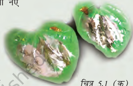
चित्र 5.1 (क) पान के पत्ते

महिलाओं और पुरुषों ने कार्य की तलाश में, प्राकृतिक आपदाओं से बचाव के लिए व्यापारियों, सैनिकों, पुरोहितों और तीर्थयात्रियों के रूप में या फिर साहस की भावना से प्रेरित होकर यात्राएँ की हैं। वे, जो किसी नए स्थान पर आते हैं अथवा बस जाते हैं, निश्चित रूप से एक ऐसी दुनिया को समझ पाते हैं जो भूदृश्य या भौतिक परिवेश के संदर्भ में और साथ ही लोगों की प्रथाओं, भाषाओं, आस्था तथा व्यवहार में भिन्न होती है। इनमें से कुछ इन भिन्नताओं के अनुरूप ढल जाते हैं और अन्य जो कुछ हद तक विशिष्ट होते हैं, इन्हें ध्यानपूर्वक अपने वृत्तांतों में लिख लेते हैं, जिनमें असामान्य तथा उल्लेखनीय बातों को अधिक महत्त्व दिया जाता है।