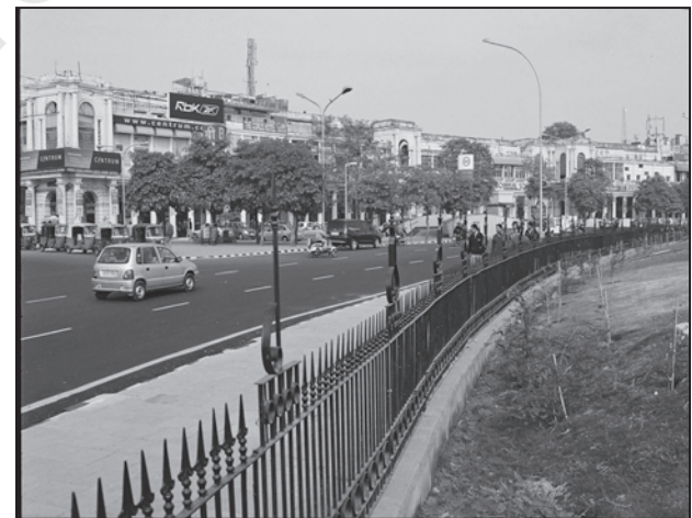
चित्र 4.4 : आधुनिक शहर का एक दृश्य

अंग्रेजों और अन्य यूरोपियों ने भारत में अनेक नगरों का विकास किया। तटीय स्थानों पर अपने पैर जमाते हुए उन्होंने सर्वप्रथम सूरत, दमन, गोआ, पांडिचेरी इत्यादि जैसे व्यापारिक पत्तन