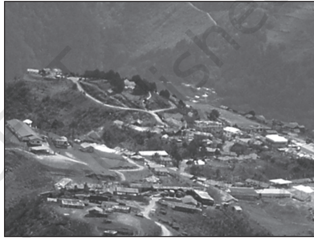
चित्र 4.2 : अर्ध-गुच्छित बस्तियाँ

अर्ध-गुच्छित अथवा विखंडित बस्तियाँ परिक्षिप्त बस्ती के किसी सीमित क्षेत्र में गुच्छित होने की प्रवृत्ति का परिणाम है। अधिकतर ऐसा प्रारूप किसी बड़े संहत गाँव के संपृथकन अथवा विखंडन के परिणामस्वरूप भी उत्पन्न हो सकता है। ऐसी स्थिति में ग्रामीण समाज के एक अथवा अधिक वर्ग स्वेच्छा से अथवा बलपूर्वक मुख्य गुच्छ अथवा गाँव से थोड़ी दूरी पर रहने लगते हैं। ऐसी स्थितियों में, आमतौर पर ज़मींदार और अन्य प्रमुख समुदाय मुख्य गाँव के केंद्रीय भाग पर