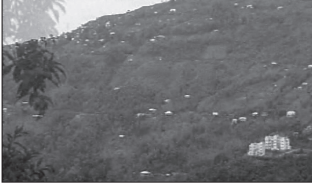
चित्र 4.3 : नागालैंड में परिक्षिप्त बस्तियाँ

भारत में परिक्षिप्त अथवा एकाकी बस्ती प्रारूप सुदूर जंगलों में एकाकी झोंपड़ियों अथवा कुछ झोंपड़ियों की पल्ली अथवा छोटी पहाड़ियों की ढालों पर खेतों अथवा चरागाहों के रूप में दिखाई पड़ता है। बस्ती का चरम विक्षेपण प्रायः भू-भाग और