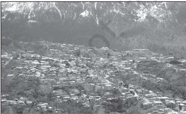
चित्र 4.1 : उत्तर-पूर्वी राज्यों में गुच्छित बस्तियाँ

गुच्छित ग्रामीण बस्ती घरों का एक संहत अथवा संकुलित रूप से निर्मित क्षेत्र होता है। इस प्रकार के गाँव में रहन-सहन का सामान्य क्षेत्र स्पष्ट और चारों ओर फैले खेतों, खलिहानों और चरागाहों से पृथक होता है। संकुलित निर्मित क्षेत्र और इसकी मध्यवर्ती गलियाँ कुछ जाने-पहचाने प्रारूप अथवा ज्यामितीय आकृतियाँ प्रस्तुत करते हैं जैसे कि आयताकार, अरीय, रैखिक इत्यादि। ऐसी बस्तियाँ प्रायः उपजाऊ जलोढ़ मैदानों और उत्तर-पूर्वी राज्यों में पाई जाती हैं। कई बार लोग सुरक्षा अथवा प्रतिरक्षा कारणों से संहत गाँवों में रहते हैं, जैसे कि मध्य भारत