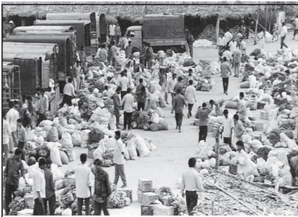
चित्र 7.2 : सब्जियों का थोक बाजार

ग्रामीण विपणन केंद्र निकटवर्ती बस्तियों का पोषण करते हैं। ये अर्ध-नगरीय केंद्र होते हैं। ये अत्यंत अल्पवर्धित प्रकार के व्यापारिक केंद्रों के रूप में सेवा करते हैं। यहाँ व्यक्तिगत और व्यावसायिक सेवाएँ सुविकसित नहीं होतीं। ये स्थानीय संग्रहण और वितरण केंद्र होते हैं। इनमें से अधिकांश केंद्रों में मंडियाँ (थोक बाजार) और फुटकर व्यापार क्षेत्र भी होते हैं। ये स्वयं में नगरीय केंद्र नहीं हैं किंतु ग्रामीण लोगों की अधिक माँग वाली वस्तुओं और सेवाओं को उपलब्ध कराने वाले महत्त्वपूर्ण केंद्र हैं।