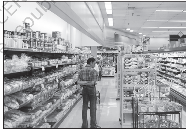
चित्र 7.3 : अमेरिका में डिब्बाबंद आहार बाजार

नगरीय बाजार केंद्रों में और अधिक विशिष्टीकृत नगरीय सेवाएँ मिलती हैं। इनमें न केवल साधारण वस्तुएँ और सेवाएँ बल्कि लोगों द्वारा वांछित अनेक विशिष्ट वस्तुएँ व सेवाएँ भी उपलब्ध होती हैं। नगरीय केंद्र, इसलिए विनिर्मित पदार्थों के साथ-साथ विशिष्टीकृत बाजार भी प्रस्तुत करते हैं जैसे श्रम बाजार, आवासन, अर्ध-निर्मित एवं निर्मित उत्पादों का बाजार। इनमें शैक्षिक संस्थाओं और व्यावसायिकों की सेवाएँ जैसे — अध्यापक, वकील, परामर्शदाता, चिकित्सक, दाँतों का डॉक्टर और पशु चिकित्सक आदि उपलब्ध होते हैं।