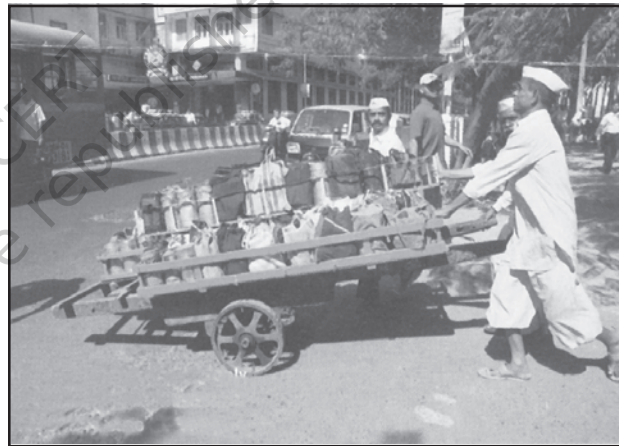
चित्र 7.4 : मुंबई में डब्बावाला सेवा

दैनिक जीवन में काम को सुविधाजनक बनाने के लिए लोगों को व्यक्तिगत सेवाएँ उपलब्ध कराई जाती हैं। कामगार रोजगार की तलाश में ग्रामीण क्षेत्रों से प्रवास करते हैं और अकुशल होते हैं। वे मोची, गृहपाल, खानसामा और माली जैसी घरेलू सेवाओं के लिए नियुक्त किए जाते हैं और इन्हें कम भुगतान किया जाता है। कर्मियों का यह वर्ग असंगठित है। ऐसा एक उदाहरण मुंबई की डब्बावाला सेवा है जो पूरे नगर में लगभग 1,75,000 उपभोक्ताओं को उपलब्ध कराई जाती है।