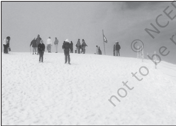
चित्र 7.5 : स्विटजरलैंड में बर्फ से ढकी पर्वत चोटी पर स्कींग करते पर्यटक

पर्यटन एक यात्रा है जो व्यापार की बजाय प्रमोद के उद्देश्यों के लिए की जाती है। कुल पंजीकृत रोजगारों तथा कुल राजस्व (सकल घरेलू उत्पाद का 40 प्रतिशत) की दृष्टि से यह विश्व का अकेला सबसे बड़ा (25 करोड़) तृतीयक क्रियाकलाप बन गया है। इनके अतिरिक्त पर्यटकों के आवास, भोजन, परिवहन, मनोरंजन तथा विशेष दुकानों जैसी सेवा उपलब्ध कराने के लिए अनेक स्थानीय व्यक्तियों को नियुक्त किया जाता है। पर्यटन अवसंरचना उद्योगों, फुटकर व्यापार तथा शिल्प उद्योगों (स्मारिका) को पोषित करता है। कुछ प्रदेशों में पर्यटन ऋतुनिष्ठ होता है क्योंकि अवकाश की अवधि अनुकूल मौसमी दशाओं पर निर्भर करती है, किंतु कई प्रदेश वर्षपर्यंत पर्यटकों को आकर्षित करते हैं।