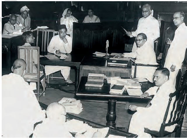
संविधान सभा में चर्चा की अध्यक्षता करते हुए डॉ. बी.आर. अंबेडकर

-डॉ. बी. आर. अंबेडकर संविधान सभा वाद-विवाद, खंड VII, पृष्ठ 37 4 नवंबर 1948