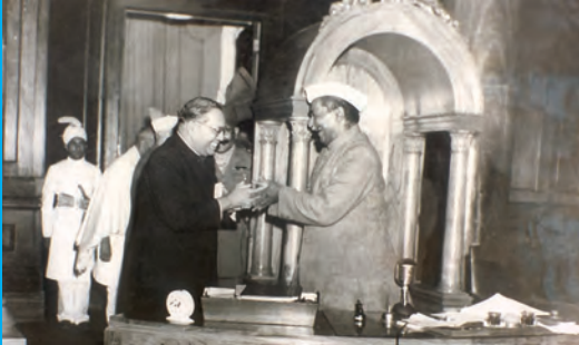
संविधान सभा के अध्यक्ष डॉ. राजेन्द्र प्रसाद और प्रारूप समिति के सभापति डॉ. बी.आर. अंबेडकर एक दूसरे का अभिवादन करते हुए

जातियों के उत्थान के लिए पर्याप्त काम न करने का आरोप लगाते थे। पटेल और नेहरू बहुत-से मुद्दों पर एक-दूसरे से असहमत थे। फिर भी सबने एक साथ मिलकर काम किया। प्रत्येक कमिटी ने आम तौर पर संविधान के कुछ-कुछ प्रावधानों का प्रारूप तैयार किया जिन पर बाद में पूरी संविधान सभा में चर्चा की गई। आम तौर पर यह प्रयास किया गया कि फ़ैसले आम राय से हों और कोई भी प्रावधान किसी खास हित समूह के पक्ष में न हो। कई प्रावधानों पर निर्णय मत विभाजन करके भी लिए गए। ऐसे अवसरों पर भी हर सरोकार का ध्यान रखा गया और हर तर्क और शंका का समाधान बहुत ही सावधानी से किया गया। लिखित रूप में उनका जवाब दिया गया। दो वर्ष और ग्यारह महीने की अवधि में संविधान सभा की बैठकें 166 दिनों तक चलीं। इसके सत्र अखबारों और आम लोगों के लिए खुले हुए थे।