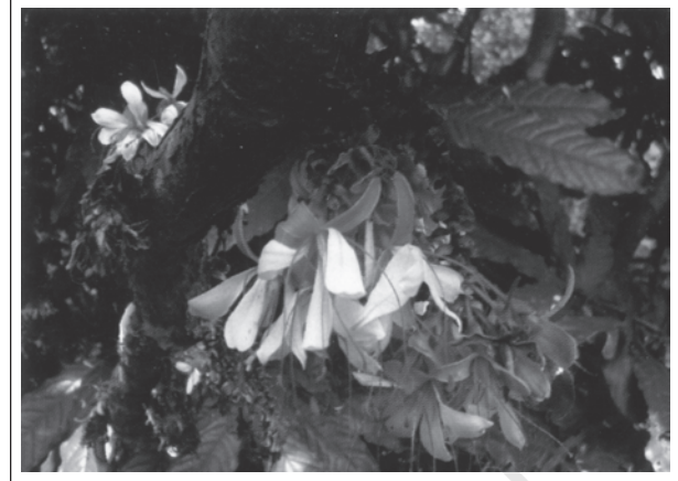
हमबोशिया डेकरेंस बेड- दक्षिण पश्चिमी घाट ( भारत ) की एक दुर्लभ प्रजाति

विश्व की सभी संकटापन्न प्रजातियों के बारे में (Red list) रेड लिस्ट के नाम से सूचना प्रकाशित करता है।