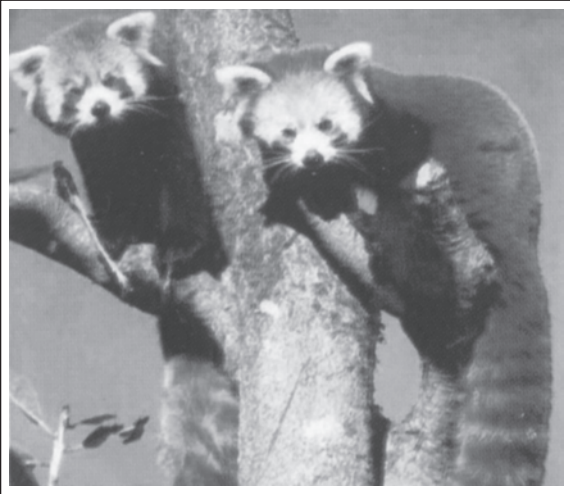
रेड पांडा - एक संकटापन्न प्रजाति