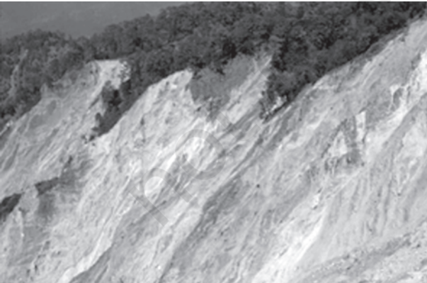
चित्र 6.3 : भारत-नेपाल सीमा, उत्तर प्रदेश में शारदा नदी के निकट शिवालिक हिमालय शृंखलाओं में भूस्खलन स्कार

ढाल, जिसपर संचलन होता है, के संदर्भ में पश्च-आवर्तन (Rotation) के साथ शैल-मलवा की एक या कई इकाइयों के फिसलन (Slipping) को अवसर्पण कहते हैं। पृथ्वी के पिंड के पश्च-आवर्तन के बिना मलवा का तीव्र लोटन (Rolling) या स्खलन मलवा स्खलन कहलाता है। मलवा स्खलन में खड़े (Vertical) या प्रलंबी फलक (Face) से मिट्टी मलवा का प्रायः स्वतंत्र पतन होता है। संस्तर जोड़ या भ्रंश के नीचे पृथक शैल बृहत् के स्खलन को शैल