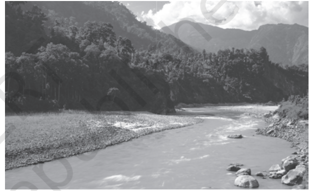
चित्र 3.1 : पर्वतीय क्षेत्र की एक नदी

दिशा से दूसरी दिशा में बहने का कारण बता सकते हैं? उत्तर में हिमालय तथा दक्षिण में पश्चिमी घाट