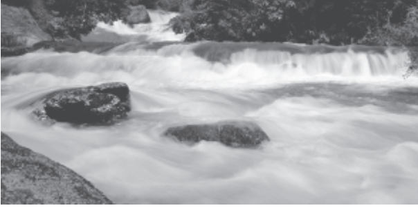
चित्र 3.3 : क्षिप्रिकाएँ

समतल घाटियों, गोखुर झीलें, बाढ़कृत मैदान, गुंफित वाहिकाएँ और नदी के मुहाने पर डेल्टा का निर्माण करती हैं। हिमालय क्षेत्र में इन नदियों का रास्ता टेढ़ा-मेढ़ा है, परंतु मैदानी क्षेत्र में इनमें सर्पाकार मार्ग में बहने की प्रवृत्ति पाई जाती है और अपना रास्ता बदलती रहती हैं। कोसी नदी, जिसे बिहार का शोक (Sorrow of Bihar) कहते हैं, अपना मार्ग बदलने के लिए कुख्यात रही है। यह नदी पर्वतों के ऊपरी क्षेत्रों से भारी मात्रा में अवसाद लाकर मैदानी भाग में जमा करती है। इससे नदी मार्ग अवरूद्ध हो जाता है व परिणामस्वरूप नदी अपना मार्ग बदल लेती है। कोसी नदी ऊपरी पर्वतीय क्षेत्र से इतनी भारी मात्रा में अवसाद क्यों लाती है? क्या आप सोचते हैं कि सामान्यतः नदियों में और विशेष तौर पर कोसी नदी में जल का बहाव व मात्रा एक समान रहती है या घटती-बढ़ती रहती है? नदी में कब जल की मात्रा अत्यधिक होती है? बाढ़ के सकारात्मक व नकारात्मक प्रभाव क्या हैं?