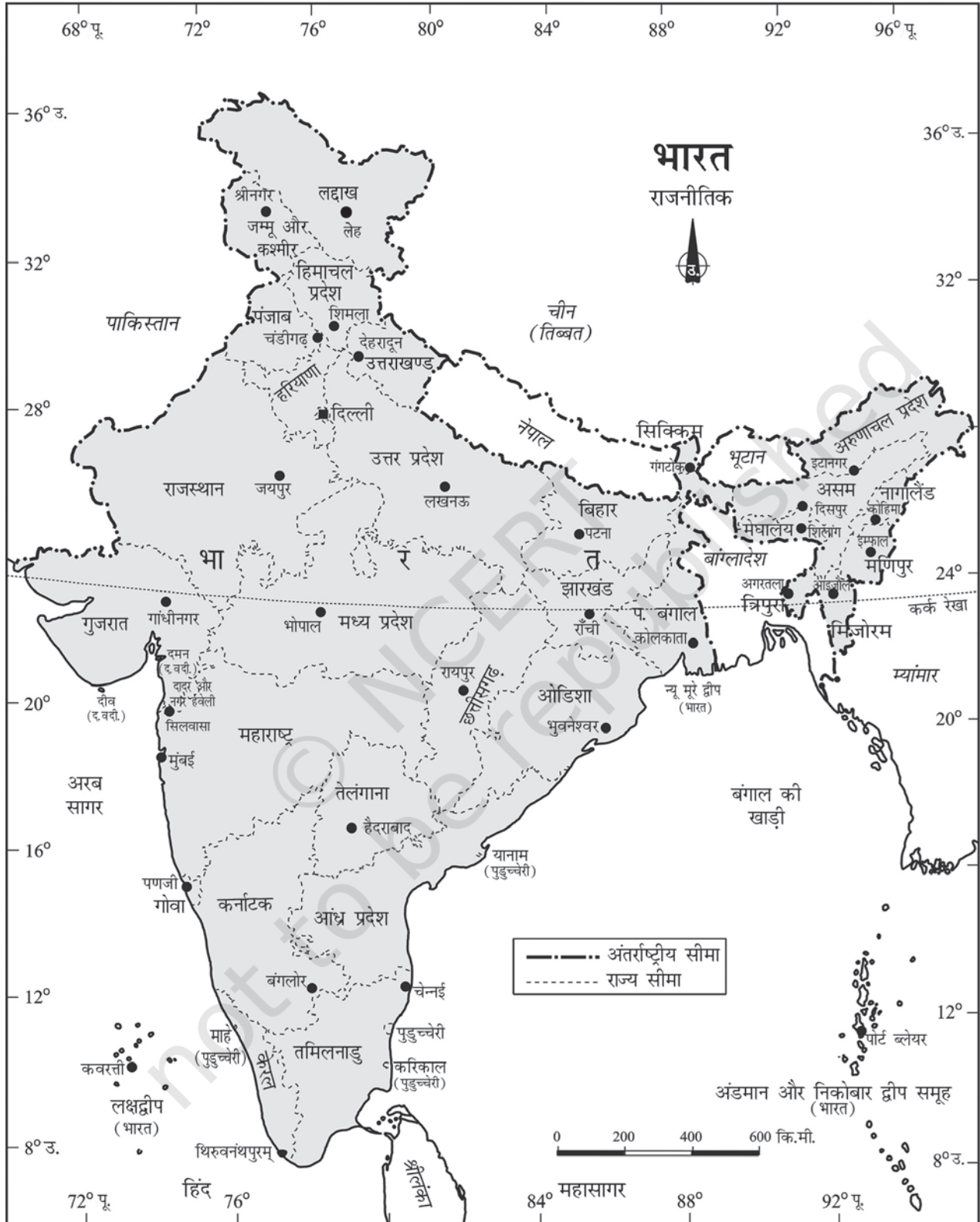
चित्र 1.1 : भारत : राजनीतिक