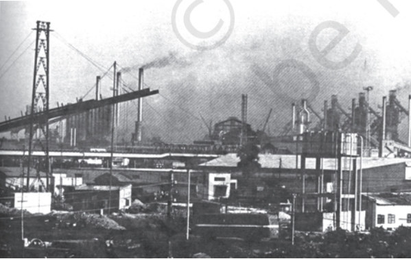
चित्र 9.2 दामोदर घाटी भारत के सर्वाधिक औद्योगिक क्षेत्रों में एक है। भारी उद्योगों से प्रदूषणकारी तत्व दामोदर नदी के किनारे जमा होकर पर्यावरण-संकट उत्पन्न कर रहे हैं

और सेवाएँ उनकी पूर्ति से बहुत कम थी। इसका अर्थ हुआ कि प्रदूषण, पर्यावरण की अवशोषी क्षमता के भीतर था और संसाधन निष्कर्षण की दर इन संसाधनों के पुनः सर्जन की दर से कम थी। इसलिए, पर्यावरण समस्याएँ उत्पन्न नहीं हुई थी। लेकिन, जनसंख्या विस्फोट और जनसंख्या की बढ़ती हुई आवश्यकताओं की पूर्ति के लिए औद्योगिक क्रांति के आगमन से स्थिति बदल गई। परिणामस्वरूप उत्पादन और उपभोग के लिए संसाधनों की माँग संसाधनों की पुनः सर्जन की दर से बहुत अधिक हो गई; पर्यावरण की अवशोषी क्षमता पर दबाव बुरी तरह से बढ़ गया। यह प्रवृत्ति आज भी जारी है। इस तरह से, पर्यावरण की गुणवत्ता के मामले में