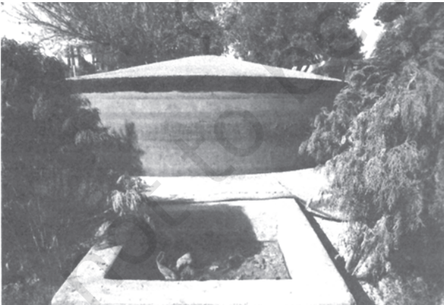
चित्र 9.4 गोबर गैस संयंत्र में ईंधन उत्पादन के लिए गोबर का प्रयोग

ऊर्जा के गैर पारंपरिक स्रोतों का उपयोग : जैसा कि आप जानते हैं कि भारत अपनी विद्युत आवश्यकताओं के लिए थर्मल और हाइड्रो पॉवर संयंत्रों पर बहुत अधिक निर्भर है। इन दोनों का पर्यावरण पर प्रतिकूल प्रभाव पड़ता है। थर्मल पॉवर संयंत्र बड़ी मात्रा में कार्बन-डाइऑक्साइड का उत्सर्जन करते हैं, जो एक ग्रीन हाउस गैस है। थर्मल पॉवर प्लांटों से बड़ी मात्रा में धुएँ के रूप में राख भी निकलती है, जिसका उचित उपयोग न हो तो जल, भूमि और पर्यावरण के अन्य संघटकों के प्रदूषण का कारण हो सकता है। जल-विद्युत परियोजनाओं से वन जलमग्न हो जाते हैं और नदी प्रवाह क्षेत्रों तथा नदी की घाटियों के प्राकृतिक प्रवाह में हस्तक्षेप करते हैं। वायु शक्ति और सौर किरणें पारंपरिक ऊर्जा के अच्छे उदाहरण हैं, तकनीकी ज्ञान के अभाव में इसका विस्तृत रूप में अभी तक विकास नहीं हो पाया है।