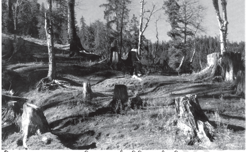
चित्र 9.3 वन-कटाव द्वारा भूमि अपक्षय, जैव विविधता की क्षति तथा वायु प्रदूषण

माँग-पूर्ति संबंध पूरी तरह से उलट गये हैं—अब हमारे सामने पर्यावरण संसाधनों और सेवाओं की माँग अधिक है, लेकिन उनकी पूर्ति सीमित है। जिसके कारण अधिक उपयोग और दुरुपयोग हैं। इसीलिए, अवशिष्ट सृजन और प्रदूषण के पर्यावरण मुद्दे आजकल बहुत गंभीर हो गये हैं।