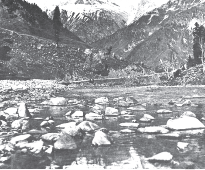
चित्र 9.1 ताजा पानी के कुछ स्रोत जो प्रदूषण रहित हैं

ऐसा नहीं होता, तो पर्यावरण जीवन पोषण का अपना तीसरा और महत्वपूर्ण कार्य करने में असफल हो जाता है और इससे पर्यावरण संकट पैदा होता है। पूरे विश्व में आज यही स्थिति है। विकासशील देशों की तेजी से बढ़ती जनसंख्या और विकसित देशों के समृद्ध उपभोग तथा उत्पादन मानकों ने पर्यावरण के पहले दो कार्यों पर भारी दबाव डाल डाला है। अनेक संसाधन विलुप्त हो गये हैं और सृजित अवशेष पर्यावरण के अवशोषी क्षमता के बाहर हैं।