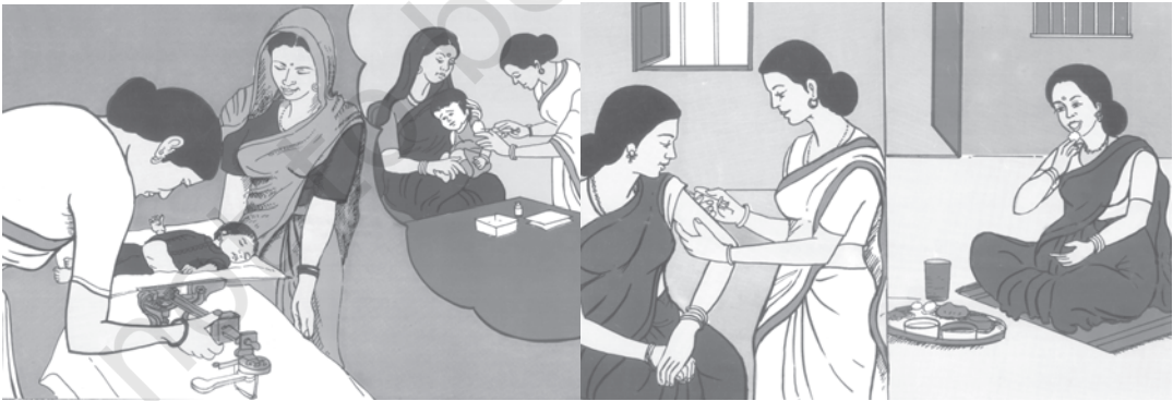
चित्र 8.10 कई प्रकार की चिकित्सा सुविधाओं के बावजूद महिलाओं की चिंताजनक स्थिति

वर्तमान में 20 प्रतिशत से भी कम जनसंख्या जन स्वास्थ्य सुविधाओं का उपभोग करती है। एक अध्ययन से पता चला कि केवल 38 प्रतिशत प्राथमिक चिकित्सा केंद्रों में डॉक्टरों की