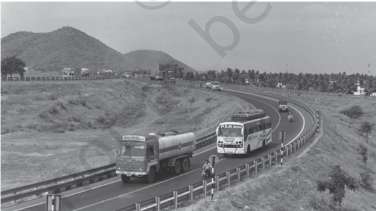
चित्र 8.1 संवृद्धि के मार्गों को जोड़ने वाली सड़कें

आधारिक संरचना औद्योगिक व कृषि उत्पादन, घरेलू व विदेशी व्यापार और वाणिज्य के प्रमुख क्षेत्रों में सहयोगी सेवाएँ उपलब्ध कराती हैं। इन सेवाओं में सड़क, रेल, बंदरगाह, हवाई अड्डे, बाँध, बिजली घर, तेल व गैस, पाईपलाइन, दूरसंचार सुविधाएँ, स्कूल-कॉलेज सहित देश की शैक्षिक व्यवस्था, अस्पताल