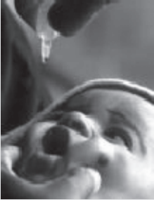
शिशु को पोलियो ड्रॉप दिया जाना

तृतीयक क्षेत्र में ऐसे प्रमुख संस्थान भी शामिल हैं जो कि न केवल उत्तम मेडिकल शिक्षा प्रदान करते और अनुसंधान करते हैं बल्कि वे विशिष्ट स्वास्थ्य सेवाएँ भी प्रदान करते हैं। इनमें से कुछ हैं- मेडिकल इंस्टीट्यूट, नयी दिल्ली, पोस्ट ग्रेजुएट इंस्टीट्यूट, चंडीगढ़; नेशनल इंस्टीट्यूट ऑफ मेंटल हेल्थ और न्यूरो साइंस, बंगलौर और ऑल इंडिया इंस्टीट्यूट ऑफ हाइजीन एंड पब्लिक हेल्थ, कोलकाता।