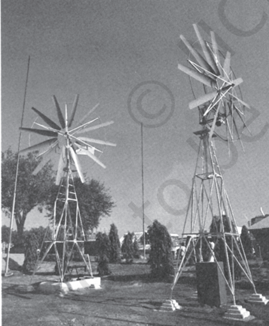
चित्र 8.7 ऊर्जा का अन्य स्रोत पवन चक्की

ऊर्जा के व्यावसायिक और गैर-व्यावसायिक स्रोतों को हम ऊर्जा के पारंपरिक स्रोत कहते हैं।