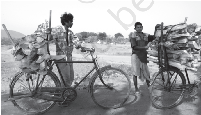
चित्र 8.5 ऊर्जा का महत्वपूर्ण स्रोत ईंधन की लकड़ी

ऊर्जा के स्रोत: ऊर्जा के व्यावसायिक और गैर व्यावसायिक स्रोत होते हैं। व्यावसायिक स्रोतों में ईंधन की लकड़ी, पेट्रोल और बिजली आते हैं क्योंकि उन्हें खरीदा और बेचा जाता है। ऊर्जा के गैर-व्यावसायिक स्रोतों में जलाऊ लकड़ी, कृषि का कूड़ा-कचरा (Waste) और