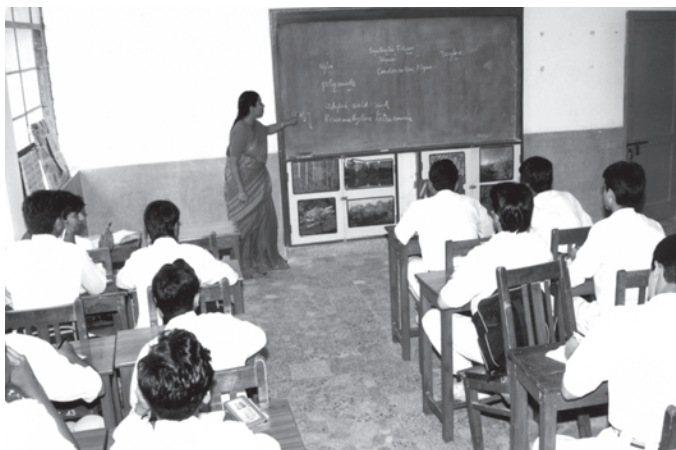
चित्र 8.2 विद्यालय किसी देश की महत्वपूर्ण आधारिक संरचना