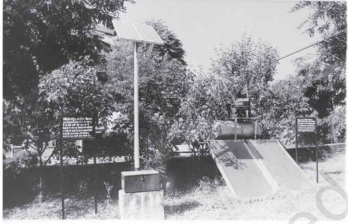
चित्र 8.8 सौर ऊर्जा के लिए बड़ी संभावनाएँ

ऊर्जा के तीन और स्रोत हैं जिन्हें हम आमतौर पर गैर-पारंपरिक स्रोत कहते हैं, वे हैं-सौर ऊर्जा, पवन ऊर्जा और ज्वार ऊर्जा। उष्ण प्रदेश होने के कारण भारत में इन तीनों प्रकार की ऊर्जाओं का उत्पादन करने की असीमित संभावनाएँ हैं। ऐसा तभी संभव होगा जबकि कोई सस्ती प्रौद्योगिकी का उपयोग किया जाये या और भी सस्ती प्रौद्योगिकी विकसित की जाये।