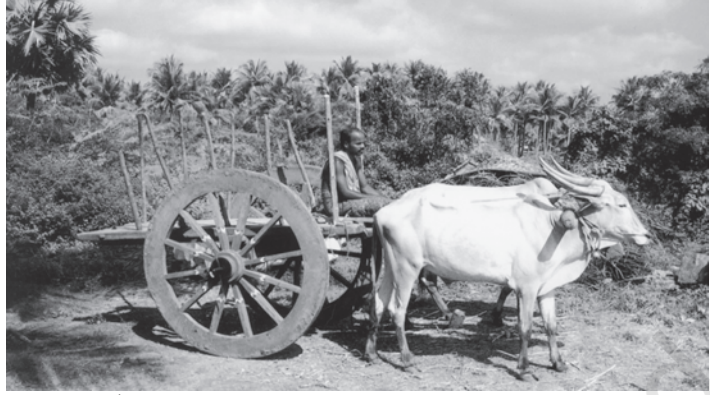
चित्र 8.6 बैलगाड़ी अभी भी ग्रामीण परिवहन बाजार का महत्वपूर्ण माध्यम

हमें ऊर्जा की आवश्यकता क्यों पड़ती है? किन स्वरूपों में यह उपलब्ध है? किसी राष्ट्र की