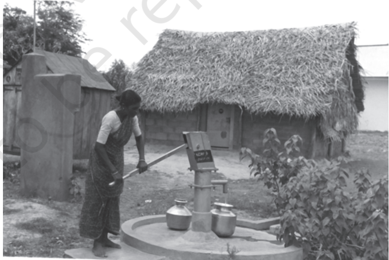
चित्र 8.4 पक्के घर के साथ स्वच्छ पेय जल: अभी भी एक स्वप्न

हमारी बहुसंख्य आबादी ग्रामीण क्षेत्रों में निवास करती है। विश्व में अत्यधिक तकनीकी उन्नति के बावजूद ग्रामीण महिलाएँ अपनी ऊर्जा की आवश्यकताओं की पूर्ति हेतु फसल का बचा-खुचा, गोबर और जलाऊ लकड़ी जैसे जैव ईंधन का आज भी