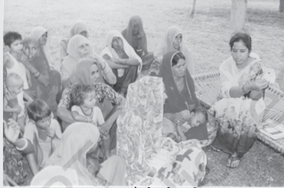
स्वास्थ्य जागरूकता गोष्ठी की प्रगति पर

भारत की स्वास्थ्य आधारिक संरचना और स्वास्थ्य सुविधाओं की तीन स्तरीय व्यवस्था है- प्राथमिक, द्वितीयक और तृतीयक। प्राथमिक क्षेत्रक सुविधाओं में प्रचलित स्वास्थ्य समस्याओं का ज्ञान तथा उन्हें पहचानने, रोकने और नियंत्रित करने की विधि, खाद्य पूर्ति तथा उचित पोषण और जल की पर्याप्त पूर्ति तथा मूलभूत स्वच्छता, शिशु एवं मातृत्व देखभाल, प्रमुख संक्रामक बीमारियों और चोटों से प्रतिरोध तथा मानसिक स्वास्थ्य का संवर्द्धन और आवश्यक दवाओं का प्रावधान शामिल है। ऑक्सीलियरी नर्सिंग मिडवाइफ (ए.एन.एम.) पहला व्यक्ति है, जो ग्रामीण इलाके में प्राथमिक स्वास्थ्य देखभाल प्रदान करता है। प्राथमिक चिकित्सा प्रदान करने के लिए गाँवों तथा छोटे कस्बों में अस्पताल बनाये गये हैं। आमतौर पर यहां एक डॉक्टर, एक नर्स और सीमित मात्रा में दवाएँ उपलब्ध होती हैं। इन्हें प्राथमिक चिकित्सा केंद्र, सामुदायिक चिकित्सा केंद्र और उपकेंद्रों के नाम से जाना जाता है। जब एक रोगी की हालत में प्राथमिक चिकित्सा केंद्र में सुधार नहीं हो पाता, तो उन्हें द्वितीयक या मध्य या उच्च श्रेणी के अस्पतालों में भेजा जाता है। जिन अस्पतालों में शल्य-चिकित्सा, एक्सरे, इ.सी.जी. जैसी बेहतर सुविधाएं होती हैं, उन्हें माध्यमिक चिकित्सा संस्थाएँ कहते हैं। वे प्राथमिक चिकित्सा और बेहतर स्वास्थ्य सुविधाएँ, दोनों ही प्रदान करते हैं। वे प्रायः जिला मुख्यालय और बड़े कस्बों में होते हैं। ऐसे सभी अस्पताल जहाँ उच्च-स्तर के उपकरण और दवाइयाँ उपलब्ध हों और जो कि ऐसे गंभीर स्वास्थ्य समस्याओं का निपटान करें जिसकी सुविधाएँ प्राथमिक या माध्यमिक अस्पतालों में हो, तृतीयक क्षेत्र में आते हैं।