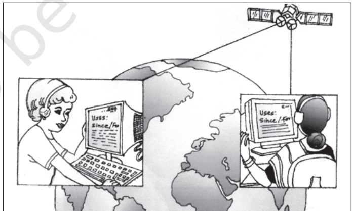
चित्र 3.1 बाह्य प्रापण : बड़े शहरों में रोजगार का एक नया अवसर

सरकार ने सार्वजनिक उपक्रमों को प्रबंधकीय निर्णयों में स्वायत्तता प्रदान कर उनकी कार्यकुशलता को सुधारने का प्रयास किया है। उदाहरण के लिए, कुछ सार्वजनिक उपक्रमों को 'महारत्न', 'नवरत्न' और 'लघुरत्न' का विशेष दर्जा दिया गया है (देखें बॉक्स 3.1)।