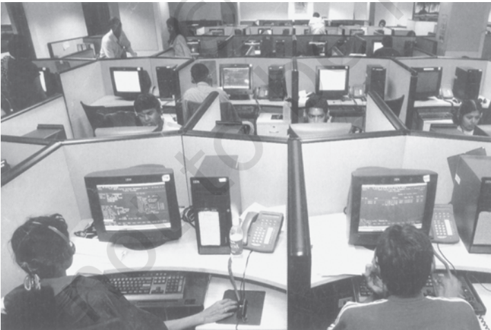
चित्र 3.2 सूचना प्रौद्योगिकी उद्योग का भारत के निर्यात में प्रमुख योगदान

कुछ विद्वानों को आशंका है कि विश्व व्यापार संगठन में भारत की सदस्यता का कोई औचित्य नहीं है, क्योंकि विश्व व्यापार का अधिकांश भाग तो विकसित देशों के बीच ही होता है। उनका यह भी मानना है कि विकसित देश अपने देशों में जहाँ कृषि सहायिकी दिये जाने को लेकर शिकायत करते हैं, वहीं विकासशील देश अपने बाजारों को विकसित देशों के लिए खोले जाने को