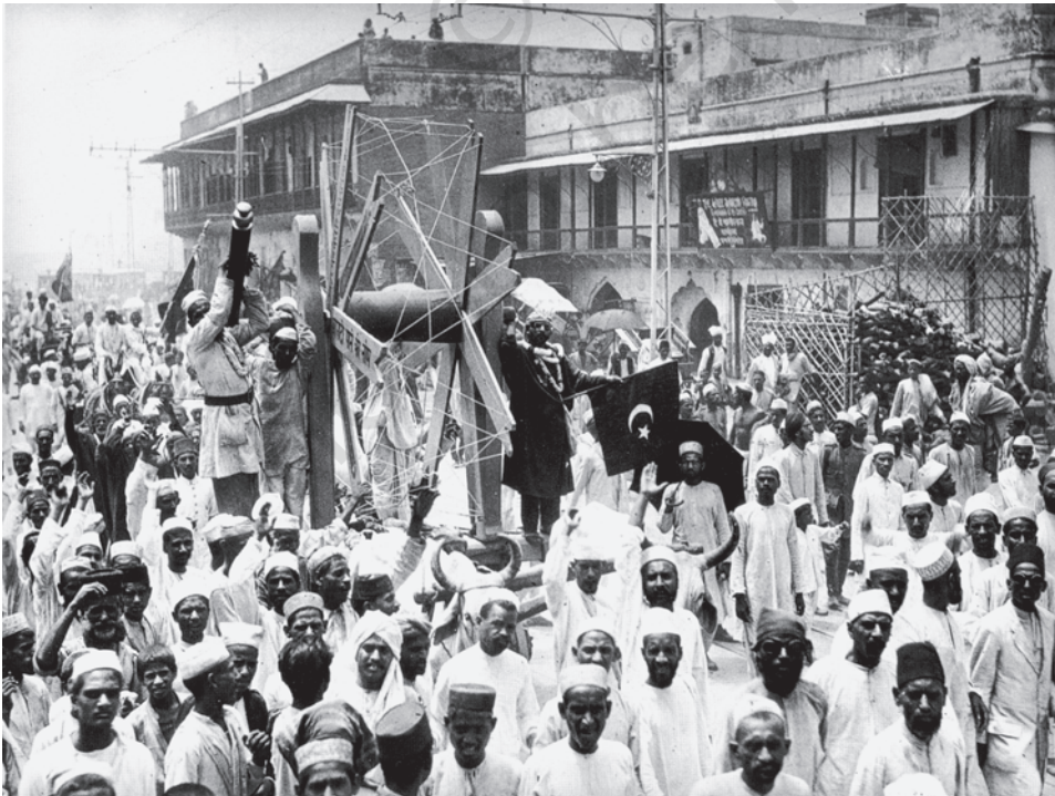
चित्र 4 - विदेशी कपड़े का बहिष्कार, जुलाई 1922 विदेशी कपड़ों को पश्चिमी आर्थिक एवं सांस्कृतिक प्रभुत्व का प्रतीक माना जाता था।

बहिष्कार : किसी के साथ संपर्क रखने और जुड़ने से इनकार करना या गतिविधियों में हिस्सेदारी, चीजों की खरीद व इस्तेमाल से इनकार करना। आमतौर पर यह विरोध का एक रूप होता है।