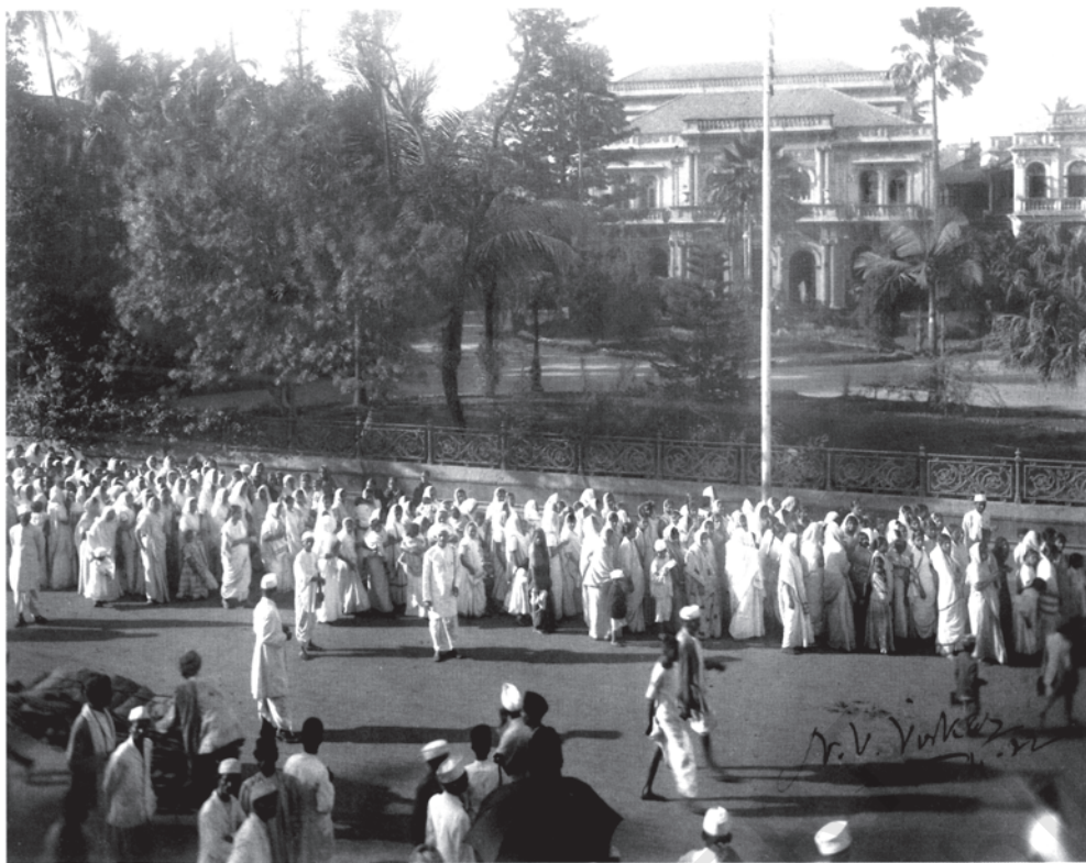
चित्र 9 - राष्ट्रवादी जुलूसों में औरतें भी शामिल थीं।

राष्ट्रीय आंदोलन के दौरान बहुत सारी औरतें अपनी जिदगी में पहली बार अपने घर से निकलकर सार्वजनिक क्षेत्र में आई थीं। इस चित्र में आप बच्चों को गोद में लिए बहुत सारी ज्यादा उम्र वाली औरतों और माँओं को भी जुलूस में देख सकते हैं।