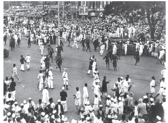
चित्र 8 - सत्याग्रहियों पर हमला करती पुलिस, 1930

महात्मा गांधी ने एक बार फिर आंदोलन वापस ले लिया। 5 मार्च 1931 को उन्होंने इरविन के साथ एक समझौते पर दस्तख़त कर दिए। इस गांधी-इरविन समझौते के ज़रिए गांधीजी ने लंदन में होने वाले दूसरे गोलमेज़ सम्मेलन में हिस्सा लेने पर अपनी सहमति व्यक्त कर दी (पहले