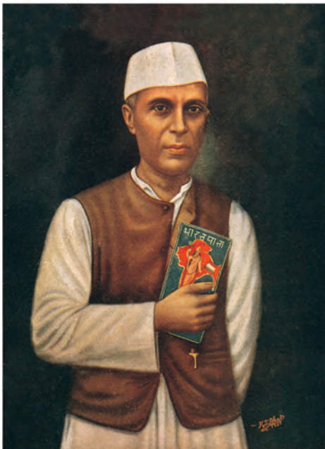
चित्र 13 - जवाहरलाल नेहरू, एक लोकप्रिय चित्र।

इस चित्र में नेहरू भारत माता और भारत के नक्शे को हृदय के पास रखे दिखाई दे रहे हैं। बहुत सारे चित्रों में राष्ट्रवादी नेताओं को अपना सिर भारत माता के चरणों में चढ़ाते हुए दर्शाया गया है। माँ के लिए बलिदान का विचार लोगों की कल्पना में बहुत महत्वपूर्ण था।