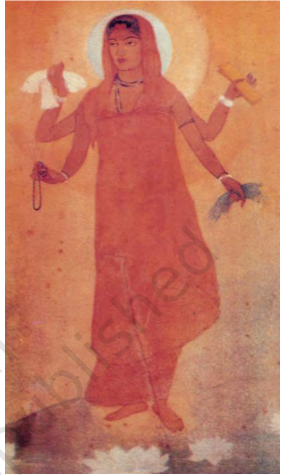
चित्र 12 - भारत माता, अबनीन्द्रनाथ टैगोर, 1905 ध्यान से देखें कि यहाँ दर्शाई गई माँ की छवि शिक्षा, भोजन और कपड़े दे रही है। एक हाथ में माला उसके संन्यासी गुण को रेखांकित करती है। अपने पूर्ववर्ती रवि वर्मा की भाँति अबनीन्द्रनाथ टैगोर ने भी ऐसी चित्र शैली विकसित करने का प्रयास किया जिसे सच्चे अर्थों में भारतीय माना जा सके।

राष्ट्रवाद का विचार भारतीय लोक कथाओं को पुनर्जीवित करने के आंदोलन से भी मजबूत हुआ। उन्नीसवीं सदी के आखिर में राष्ट्रवादियों ने भाटों व चारणों द्वारा गाई-सुनाई जाने वाली लोक कथाओं को दर्ज करना शुरू कर दिया। वे लोक गीतों व जनश्रुतियों को इकट्ठा करने के लिए गाँव-गाँव घूमने लगे। उनका मानना था कि यही कहानियाँ हमारी उस परंपरागत संस्कृति की सही तसवीर पेश करती हैं जो बाहरी ताकतों के प्रभाव से भ्रष्ट और दूषित हो चुकी है। अपनी राष्ट्रीय पहचान को ढूँढ़ने और अपने अतीत में गौरव का भाव पैदा करने के लिए इस लोक परंपरा को बचाकर रखना जरूरी था। बंगाल में खुद रबीन्द्रनाथ टैगोर भी लोक-गाथा गीत, बाल गीत और मिथकों