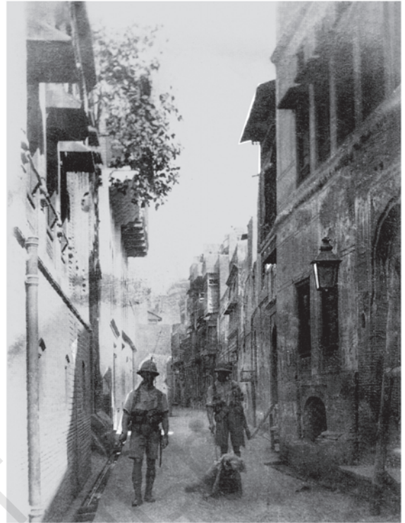
चित्र 3 - जनरल डायर के हुक्म से सिपाही लोगों को घिसट कर चलने के लिए मजबूर कर रहे हैं, पंजाब, 1919

अपनी प्रसिद्ध पुस्तक हिंद स्वराज (1909) में महात्मा गांधी ने कहा था कि भारत में ब्रिटिश शासन भारतीयों के सहयोग से ही स्थापित हुआ था और यह शासन इसी सहयोग के कारण चल पा रहा है। अगर भारत के लोग अपना सहयोग वापस ले लें तो साल भर के भीतर ब्रिटिश शासन ढह जाएगा और स्वराज की स्थापना हो जाएगी।