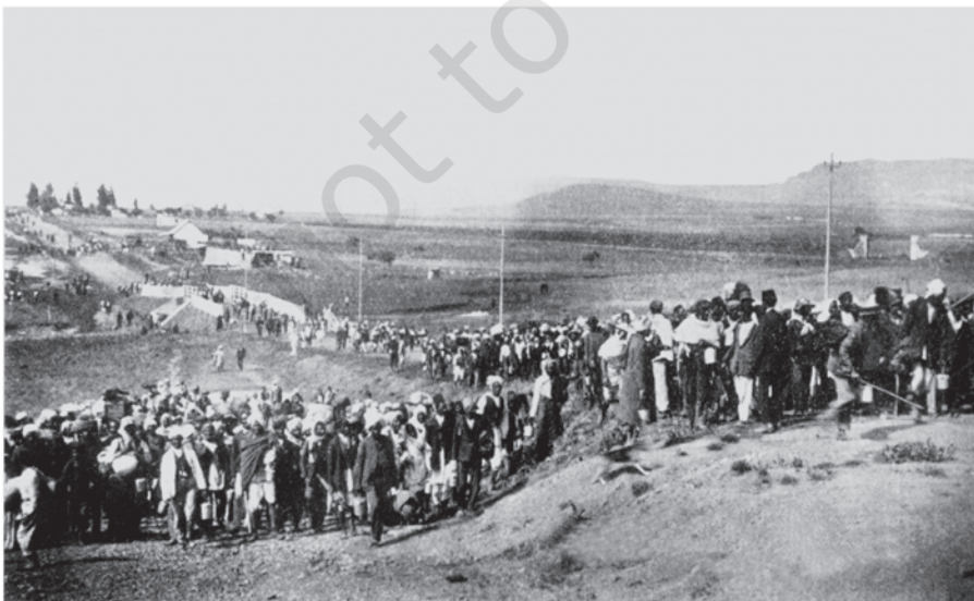
चित्र 2 - दक्षिण अफ्रीका में भारतीय मजदूर फोकस्वस्ट से गुज़र रहे हैं, 6 नवंबर 1913

महात्मा गांधी जनवरी 1915 में भारत लौटे। इससे पहले वे दक्षिण अफ्रीका में थे। उन्होंने एक नए तरह के जनांदोलन के रास्ते पर चलते हुए वहाँ की