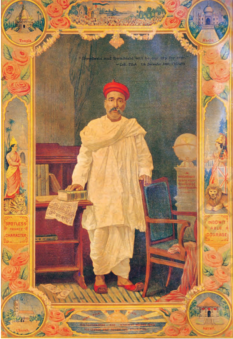
चित्र 11 - बालगंगाधर तिलक, बीसवीं सदी के शुरू की तसवीर। ध्यान से देखें कि तिलक एकता के प्रतीकों से घिरे हुए हैं। चित्र के चारों ओर विभिन्न धर्मों के पवित्र स्थान (मंदिर, चर्च, मस्जिद) चित्रित किए गए हैं।

राष्ट्रवाद की भावना तब पनपती है जब लोग ये महसूस करने लगते हैं कि वे एक ही राष्ट्र के अंग हैं; जब वे एक-दूसरे को एकता के सूत्र में बाँधने वाली कोई साझा बात ढूँढ़ लेते हैं। लेकिन राष्ट्र लोगों के मस्तिष्क में एक यथार्थ का रूप कैसे लेता है? विभिन्न समुदायों, क्षेत्रों या भाषाओं से संबद्ध अलग-अलग समूहों ने सामूहिक अपनेपन का भाव कैसे विकसित किया?