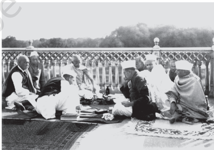
चित्र 6 - इलाहाबाद में कांग्रेस के नेताओं की बैठक, 1931

साइमन कमीशन के खिलाफ़ शांतिपूर्ण प्रदर्शन के दौरान ब्रिटिश पुलिस ने लाला लाजपत राय पर हमला किया। प्रदर्शन के दौरान मिले गहरे जख्मों के कारण उन्होंने दम तोड़ दिया।