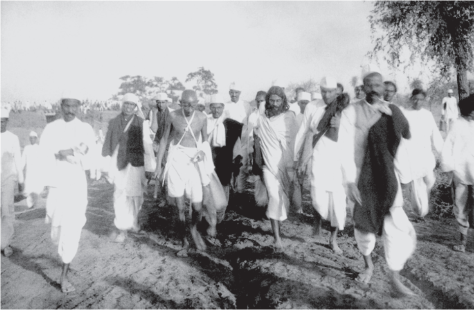
चित्र 7 - दांडी मार्च।

नमक यात्रा के दौरान महात्मा गांधी के साथ उनके 78 सहयोगी भी गए थे। रास्ते में हज़ारों लोग इस यात्रा में जुड़ते गए।