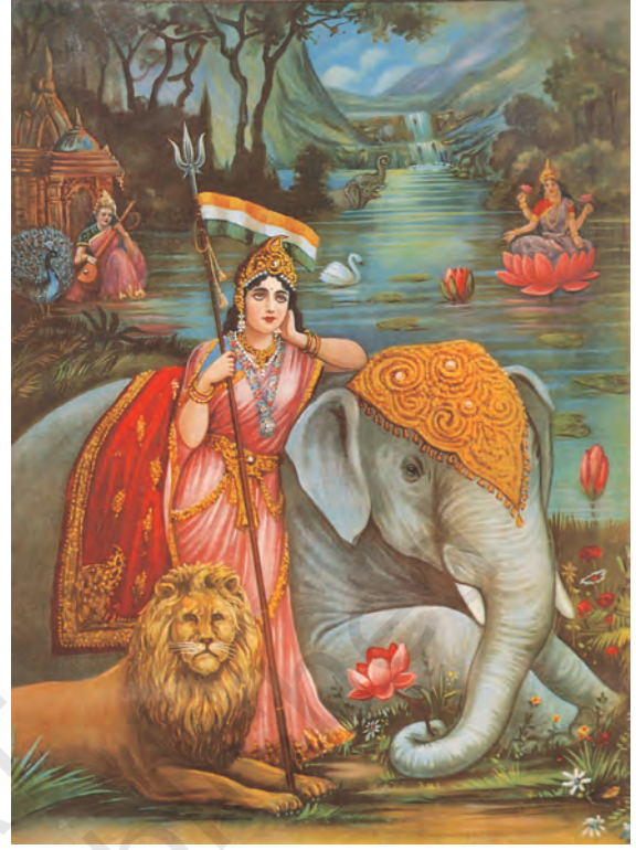
चित्र 14 - भारत माता।

लोगों को एकजुट करने की इन कोशिशों की अपनी समस्याएँ थीं। जिस अतीत का गौरवगान किया जा रहा था वह हिंदुओं का अतीत था। जिन