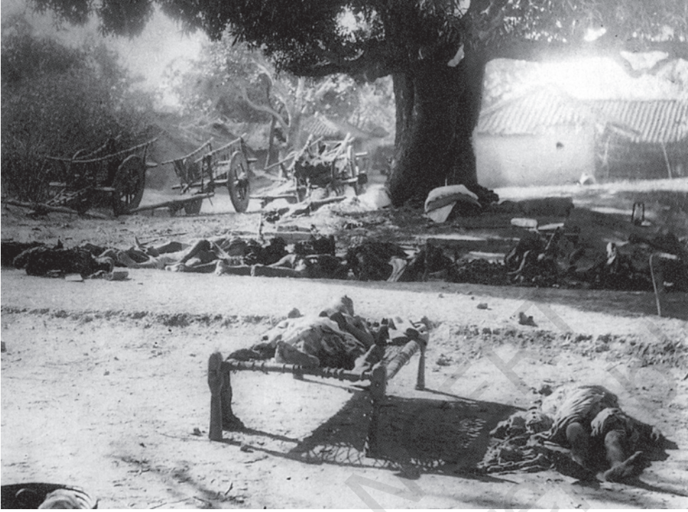
चित्र 5 - चौरा-चौरा, 1922

आदिवासियों ने गांधीजी के नाम का नारा लगाया और 'स्वतंत्र भारत' की हुंकार भरी तो वे एक अखिल भारतीय आंदोलन से भी भावनात्मक स्तर पर जुड़े हुए थे। जब वे महात्मा गांधी का नाम लेकर काम करते थे या अपने आंदोलन को कांग्रेस के आंदोलन से जोड़कर देखते थे तो वास्तव में एक ऐसे आंदोलन का अंग बन जाते थे जो उनके इलाके तक ही सीमित नहीं था।