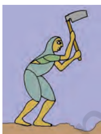
श्रम सभी संपत्तियों का स्रोत है।

उत्खनन सहित कृषि (जिसे प्राथमिक क्षेत्रक भी कहते हैं) और विनिर्माण (जिसे द्वितीयक क्षेत्रक भी कहते हैं), इन दो क्षेत्रकों के बीच उत्पादन-गतिविधियों का विभाजन आर्थिक विकास का संभवतः प्रथम दृष्ट स्वरूप था। यह विभाजन 'श्रम-विभाजन' की प्रक्रिया के माध्यम से हुआ। यह नाम अर्थशास्त्र के जनक एडम स्मिथ द्वारा दिया गया था। इस प्रक्रिया की संक्षिप्त व्याख्या नीचे की गई है।