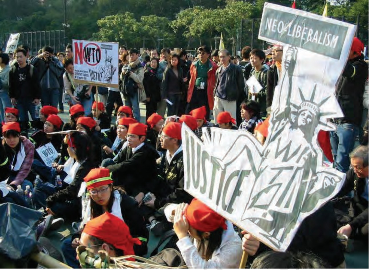
हांगकांग में डब्लू.टी.ओ. के खिलाफ प्रदर्शन-2005