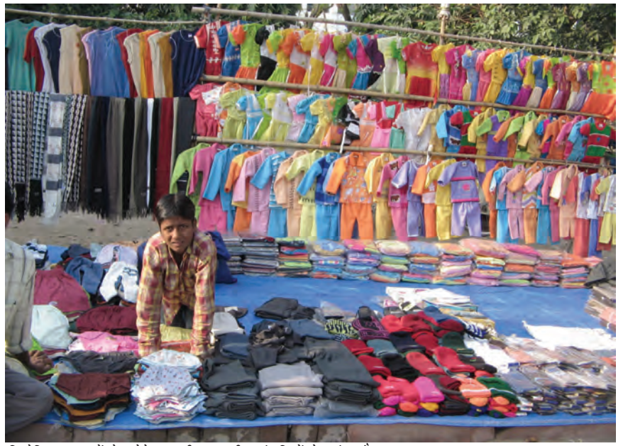
सिलेसिलाए वस्त्रों के छोटे व्यापारी बहुराष्ट्रीय कंपनियों के ब्रांड और आयात दोनों से कड़ी प्रतिस्पर्धा का सामना करते हुए।

सामान्यतः व्यापार के खुलने से वस्तुओं का एक बाज़ार से दूसरे बाज़ार में आवागमन होता है। बाज़ार में वस्तुओं के विकल्प बढ़ जाते हैं। दो बाज़ारों में एक ही वस्तु का मूल्य एक समान होने लगता है। अब दो देशों के उत्पादक एक दूसरे से हजारों मील दूर होकर भी एक दूसरे से प्रतिस्पर्धा कर सकते हैं। इस प्रकार, विदेश व्यापार विभिन्न देशों के बाज़ारों को जोड़ने या एकीकरण में सहायक होता है।