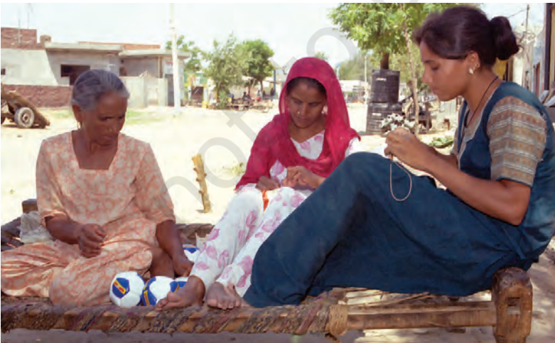
लुधियाना के एक घर में एक बड़ी बहुराष्ट्रीय कंपनी के लिए फुटबाल-निर्माण का चित्र

इस प्रकार, हम देखते हैं कि बहुराष्ट्रीय कंपनियाँ कई तरह से अपने उत्पादन कार्य का प्रसार कर रही हैं और विश्व के कई देशों की स्थानीय कंपनियों के साथ पारस्परिक संबंध स्थापित कर रही हैं। स्थानीय कंपनियों के साथ साझेदारी द्वारा, आपूर्ति के लिए स्थानीय कंपनियों का इस्तेमाल करके और स्थानीय कंपनियों से निकट प्रतिस्पर्धा करके अथवा उन्हें खरीद कर बहुराष्ट्रीय कंपनियाँ दूरस्थ स्थानों के उत्पादन पर अपना प्रभाव जमा रही हैं। परिणामतः दूर-दूर स्थानों पर फैला उत्पादन परस्पर संबंधित हो रहा है।