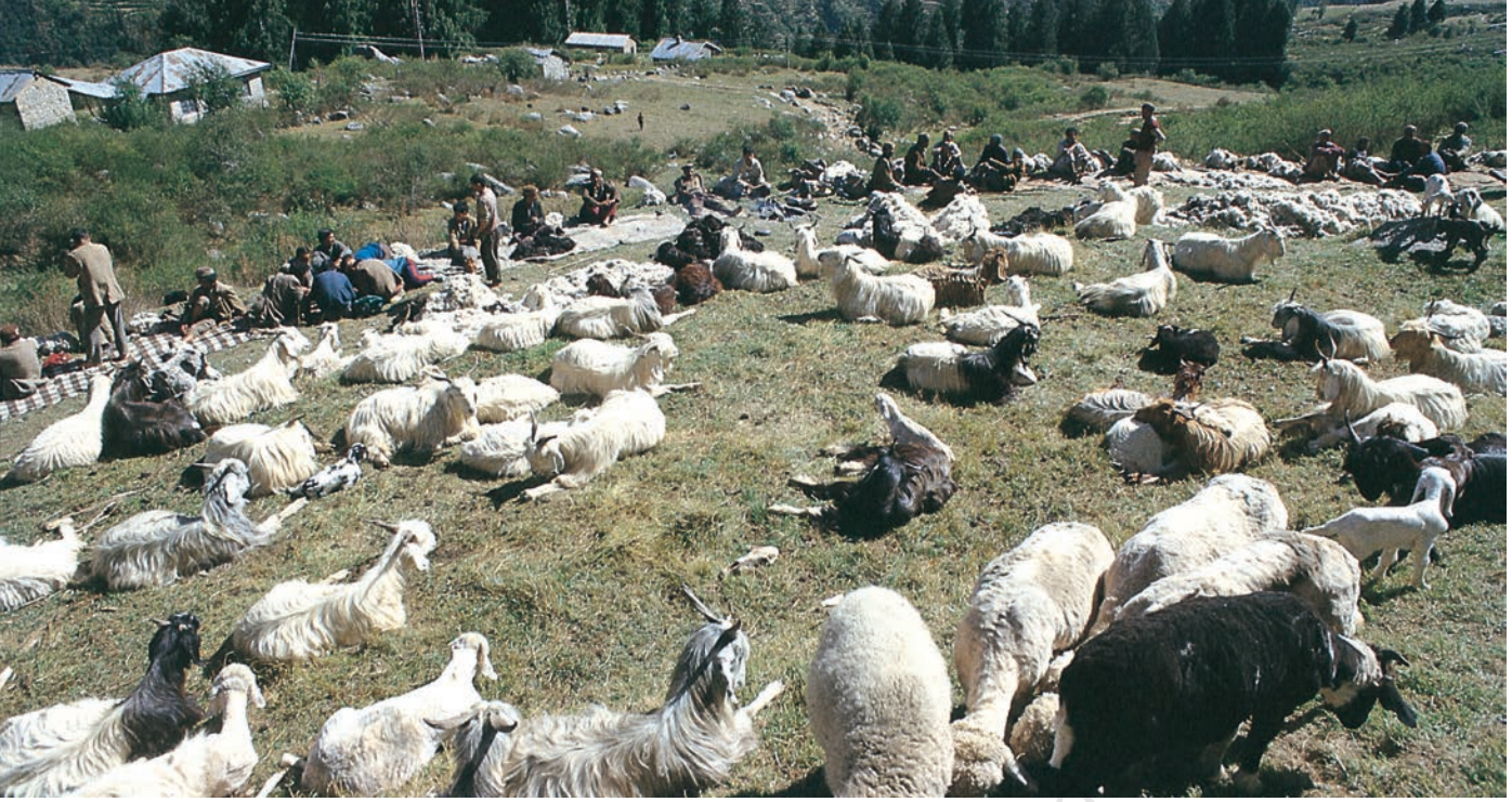
चित्र 3 - ऊन उतरने का इंतज़ार। हिमाचल प्रदेश स्थित पालमपुर के पास उहल घाटी।

और स्पीति के गाँवों में एक बार फिर कुछ समय के लिए रुकते। इस बीच वे गर्मियों की फ़सलें काटते और सर्दियों की फ़सलों की बुवाई करके आगे बढ़ जाते। यहाँ से वे अपने रेवड़ लेकर शिवालिक की पहाड़ियों में जाड़ों वाले चरागाहों में चले जाते और अगली अप्रैल में भेड़-बकरियाँ लेकर वे दोबारा गर्मियों के चरागाहों की तरफ़ रवाना हो जाते।