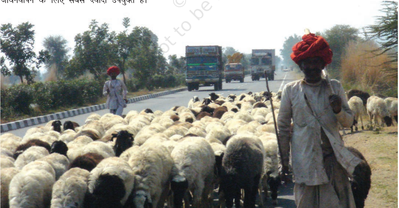
चित्र 18 - जयपुर राजमार्ग पर राइका गड़रिये.

चरवाहे अतीत के अवशेष नहीं हैं। वे ऐसे लोग नहीं हैं जिनके लिए आज की आधुनिक दुनिया में कोई जगह नहीं है। पर्यावरणवादी और अर्थशास्त्री अब इस बात को काफ़ी गंभीरता से मानने लगे हैं कि घुमंतू चरवाहों की जीवनशैली दुनिया के बहुत सारे पहाड़ी और सूखे इलाकों में जीवनयापन के लिए सबसे ज्यादा उपयुक्त है।