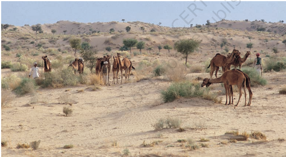
चित्र 5 - पश्चिमी राजस्थान के थार रेगिस्तान में चरते राइका समुदाय के ऊँट.

धंगर महाराष्ट्र का एक जाना-माना चरवाहा समुदाय है। बीसवीं सदी की शुरुआत में इस समुदाय की आबादी लगभग 4,67,000 थी। उनमें से ज्यादातर गड़रिये या चरवाहे थे हालाँकि कुछ लोग कम्बल और चादरें भी बनाते थे जबकि कुछ भैंस पालते थे। धंगर गड़रिये बरसात के दिनों में महाराष्ट्र के मध्य पठारों में रहते थे। यह एक अर्ध-शुष्क इलाका था जहाँ बारिश बहुत कम होती थी और मिट्टी भी खास उपजाऊ नहीं थी। चारों तरफ सिर्फ कंटैली झाड़ियाँ होती थीं। बाजरे जैसी सूखी फ़सलों के अलावा यहाँ और कुछ नहीं उगता था। मॉनसून में यह पट्टी धंगरों के जानवरों के लिए एक विशाल चरागाह बन जाती थी। अक्टूबर के आसपास धंगर बाजरे की कटाई करते थे और चरागाहों की तलाश में पश्चिम की तरफ चल पड़ते थे। करीब महीने भर पैदल चलने के बाद वे अपने रेवड़ों के साथ कोंकण के इलाके में जाकर डेरा डाल देते थे। अच्छी बारिश और उपजाऊ मिट्टी की बदौलत इस इलाके में खेती खूब होती थी। कोंकणी किसान भी इन चरवाहों का दिल खोलकर स्वागत करते थे। जिस समय धंगर कोंकण पहुँचते थे उसी समय कोंकण के किसानों को खरीफ़ की फ़सल काट कर अपने खेतों को रबी की फ़सल के लिए दोबारा उपजाऊ बनाना होता था।