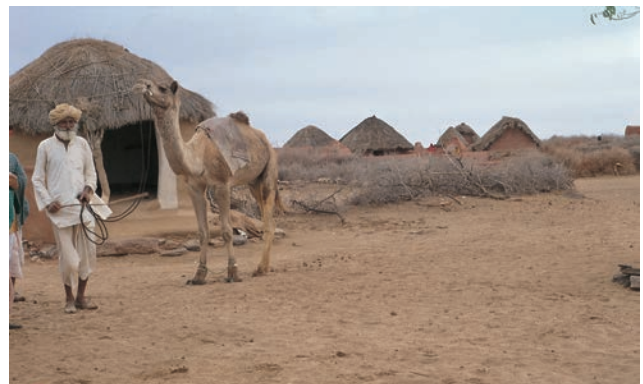
चित्र 6 - अपने ऊँट के साथ एक ऊँटपालक.

यह राजस्थान में जैसलमेर के निकट थार का रेगिस्तान है। इस इलाके के ऊँट पालकों को मारू (रेगिस्तान) राइका और उनकी बस्ती को ढंडी कहा जाता है।