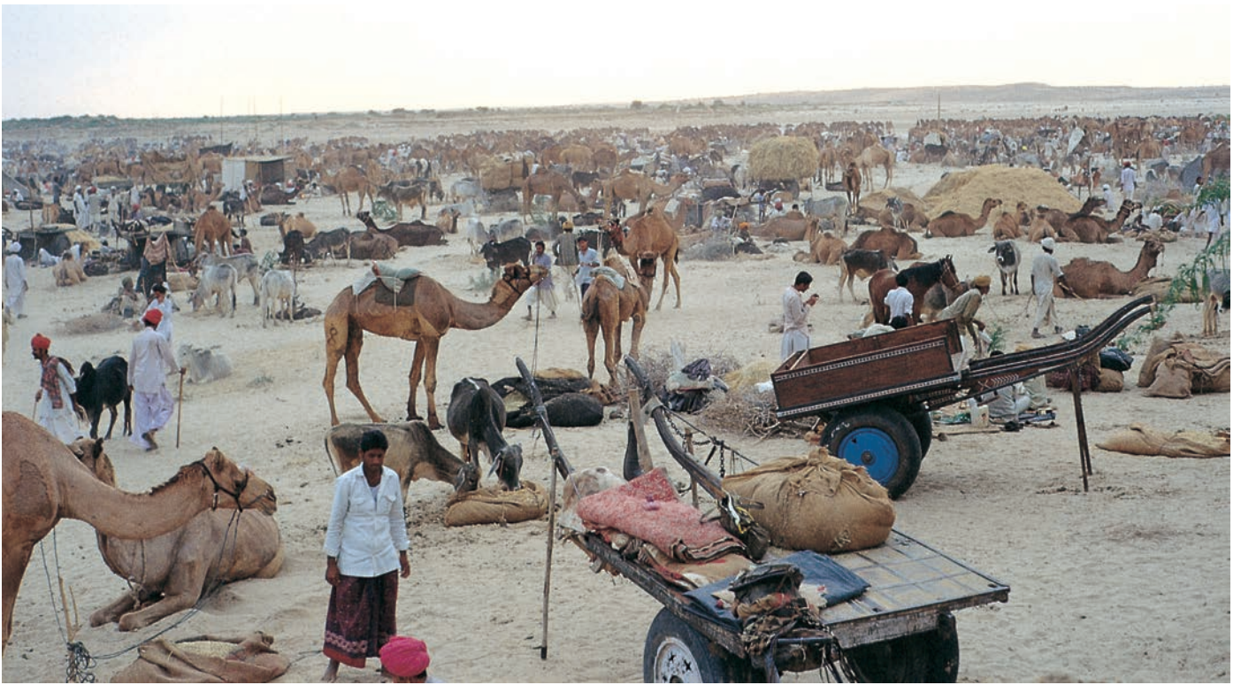
चित्र 7 - पश्चिमी राजस्थान में बलोतरा स्थित ऊँट मेला.

ऊँटपालक यहाँ ऊँटों की खरीद-फ़रोख़ा के लिए आते हैं। मेले में मारू राइका ऊँटों के प्रशिक्षण में अपनी महारत का भी प्रदर्शन करते हैं। इस मेले में गुजरात से घोड़े भी लाए जाते हैं।