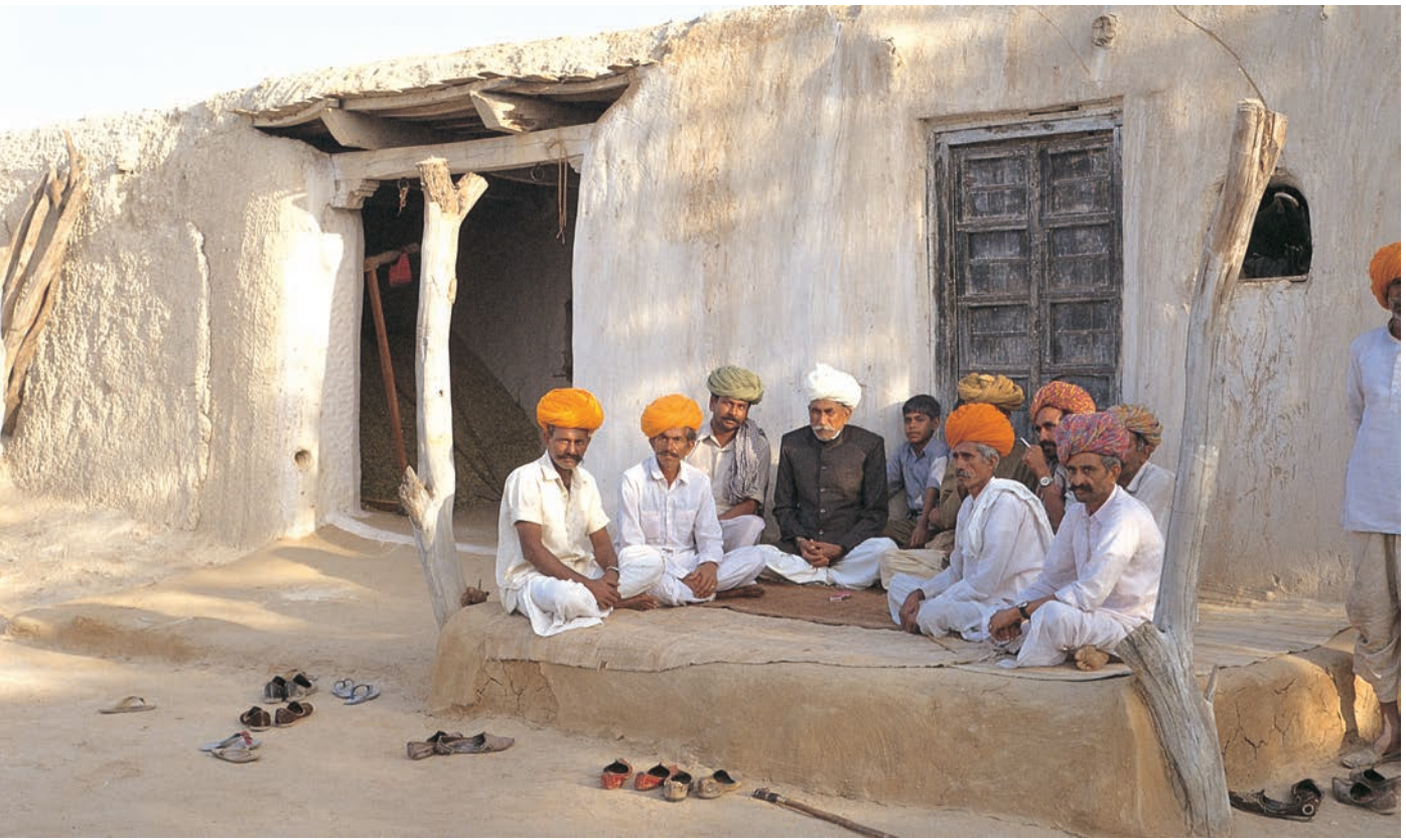
चित्र 9 - मारू राइकाओं की वंशावली बताने वाला.

वंशावली बताने वाला समुदाय का इतिहास बताता है। इस तरह की मौखिक परंपराओं से चरवाहा समुदायों को अपनी पहचान का भाव मिलता है। इन परंपराओं से हम यह पता लगा सकते हैं कि कोई समूह अपने अतीत को किस तरह देखता है।