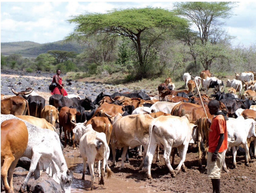
चित्र 15 - मासाई नाम 'मा' शब्द से निकला है। मा-साई का मतलब होता है 'मेरे लोग'। परंपरागत रूप से मासाई घुमंतू और चरवाहा समुदाय के लोग होते हैं जो अपनी आजीविका के लिए दूध और मांस पर आश्रित रहते हैं। ऊँचे तापमान और कम वर्षा के कारण यहाँ शुष्क, धूल भरे और बेहद गर्म हालात रहते हैं। इस अर्ध-शुष्क विषुववृत्तीय इलाके में सूखे के हालात सामान्य हैं। ऐसे समय में बहुत सारे जानवर मर जाते हैं।