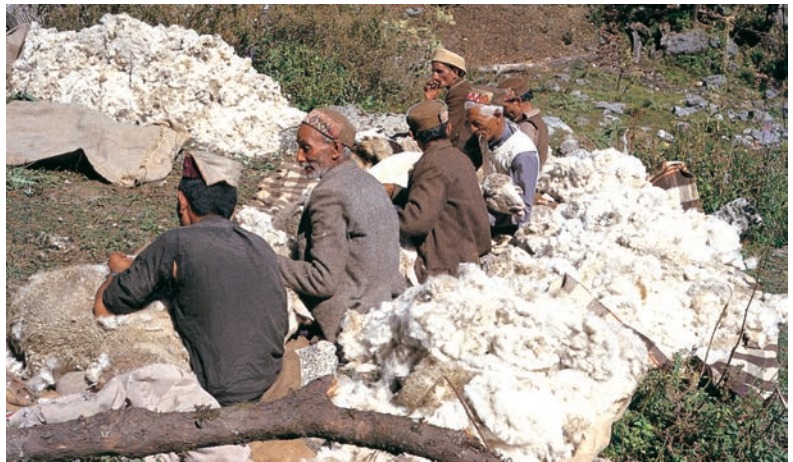
चित्र 4 - गद्दी भेड़ों की ऊन उतार रहे हैं।

भाबर : गढ़वाल और कुमाऊँ के इलाके में पहाड़ियों के निचले हिस्से के आसपास पाए जाने वाला शुष्क या सूखे जंगल का इलाका। बुग्याल : ऊँचे पहाड़ों में स्थित घास के मैदान।