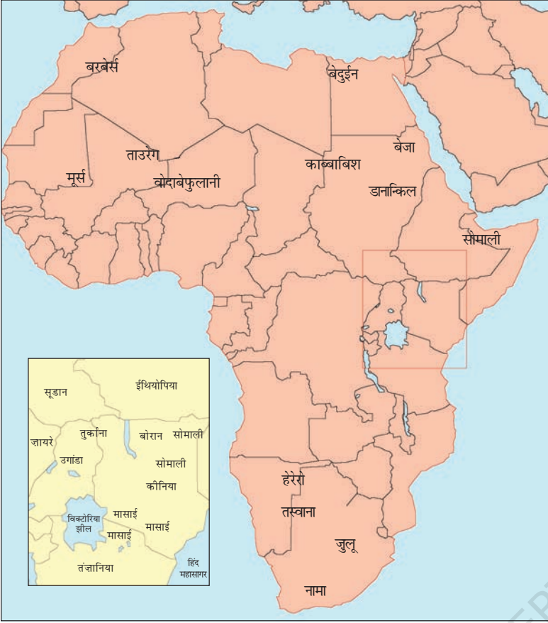
चित्र 13 - अफ्रीका के चरवाहा समुदाय.

छोटी तस्वीर (इनसेट) में कोनिया और तंजानिया में मासाइयों का इलाका दर्शाया गया है।