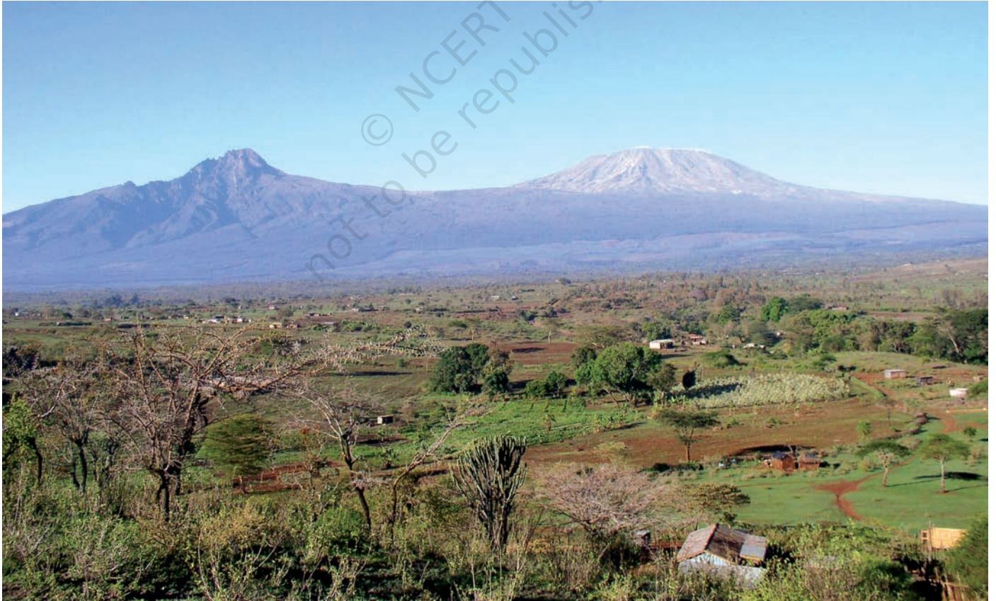
चित्र 12 - मासाई लैंड जिसके पीछे किलिमंजारो पहाड़ दिखाई दे रहे हैं।

हिंदुस्तान की तरह अफ्रीकी चरवाहों की ज़िंदगी में भी औपनिवेशिक और उत्तर-औपनिवेशिक काल में गहरे बदलाव आए हैं। आखिर क्या थे ये बदलाव?