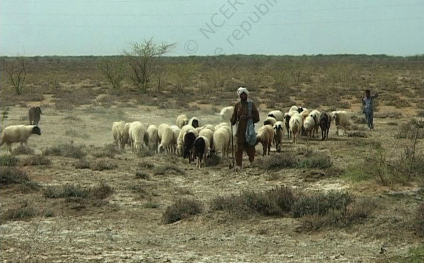
चित्र 10 - चरागाहों की तलाश में निकले मालधारी चरवाहे। उनके गाँव कच्छ की रन में स्थित हैं।

वंशावली बताने वाला समुदाय का इतिहास बताता है। इस तरह की मौखिक परंपराओं से चरवाहा समुदायों को अपनी पहचान का भाव मिलता है। इन परंपराओं से हम यह पता लगा सकते हैं कि कोई समूह अपने अतीत को किस तरह देखता है।