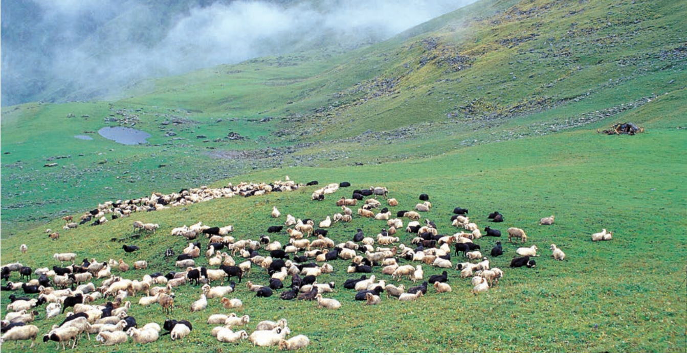
चित्र 1 - पूर्वी गढ़वाल के बुग्याल में चरती भेड़ें.

बुग्याल ऊँचे पहाड़ों पर 12,000 फुट से भी ज्यादा ऊँचाई पर स्थित विशाल प्राकृतिक चरागाह होते हैं। जाड़ों में ये बर्फ से ढके रहते हैं और अप्रैल के बाद हरे-भरे हो जाते हैं। इस समय पहाड़ियों की तलहटी तरह-तरह की घास, जड़ों और जड़ी-बूटियों से भरी रहती है। मॉनसून तक इन चरागाहों में घनी हरियाली छा जाती है और चारों तरफ फूल ही फूल दिखाई देने लगते हैं।