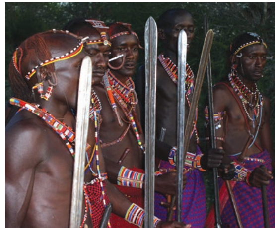
चित्र 16 - योद्धा गहरे लाल रंग की शुका और चमकदार मोतियों के आभूषण पहनते हैं तथा स्टील की नोक वाला पाँच फुट लंबा भाला रखते हैं। बारीकी से सँवारे गए उनके बाल गेरू से रंगे होते हैं। उगते सूरज को सम्मान देने के लिए वे पूर्व की ओर मुँह करके खड़े होते हैं। योद्धा अपने समुदाय की रक्षा करते हैं और लड़के पशुओं को चराते हैं। सूखे के मौसम में योद्धा और लड़के, दोनों ही पशु चराते हैं।

औपनिवेशिक काल में अफ्रीका के बाकी स्थानों की तरह मासाइलैंड में भी आए बदलावों से सारे चरवाहों पर एक जैसा असर नहीं पड़ा। उपनिवेश बनने से पहले मासाई समाज दो सामाजिक श्रेणियों में बँटा हुआ था – वरिष्ठ जन (एल्डर्स) और योद्धा (वॉरियर्स)। वरिष्ठ जन शासन चलाते थे। समुदाय से जुड़े मामलों पर विचार-विमर्श करने और अहम फैसले लेने के लिए वे समय-समय पर सभा करते थे। योद्धाओं में ज्यादातर नौजवान होते थे जिन्हें मुख्य रूप से लड़ाई लड़ने और कबीले की हिफाजत करने के लिए तैयार किया जाता था। वे समुदाय की रक्षा करते थे और दूसरे कबीलों के मवेशी छीन कर लाते थे। जहाँ जानवर ही संपत्ति हो वहाँ हमला करके दूसरों के जानवर छीन लेना एक महत्वपूर्ण काम होता था। अलग-अलग चरवाहा समुदायों की ताकत इन्हीं हमलों से तय होती थी। युवाओं को योद्धा वर्ग का हिस्सा तभी माना जाता था जब वे दूसरे समूह के मवेशियों को छीन कर और