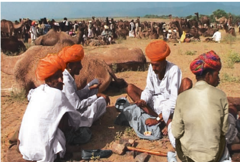
चित्र 8 - पुष्कर का ऊँट मेला.

आइए, अब देखें कि औपनिवेशिक शासन के दौरान यानी अंग्रेज़ों के ज़माने में चरवाहों का जीवन किस तरह बदला?