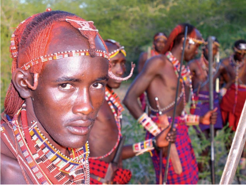
चित्र 17 - आज भी योद्धा बनने के लिए युवकों को व्यापक अनुष्ठानों से गुजरना पड़ता है हालाँकि अब यह प्रथा पहले जैसी प्रचलित नहीं है। इसके लिए युवकों को लगभग चार माह तक अपने कबीले के इलाके का दौरा करना पड़ता है। इस यात्रा के अंत में वे छापामारों की तरह दौड़कर अपने अहाते में घुसते हैं। इस समारोह के मौके पर युवक ढीले कपड़े पहनते हैं और पूरे दिन नाचते रहते हैं। इस अनुष्ठान के साथ ही वे जीवन के एक नए चरण में पहुँच जाते हैं। लड़कियों को इस तरह के अनुष्ठानों से नहीं गुजरना पड़ता। सौजन्य : द मासाई एसोसिएशन।

युद्ध में बहादुरी का प्रदर्शन करके अपनी मर्दानगी साबित कर देते थे। फिर भी वे वरिष्ठ जनों के नीचे रह कर ही काम करते थे।