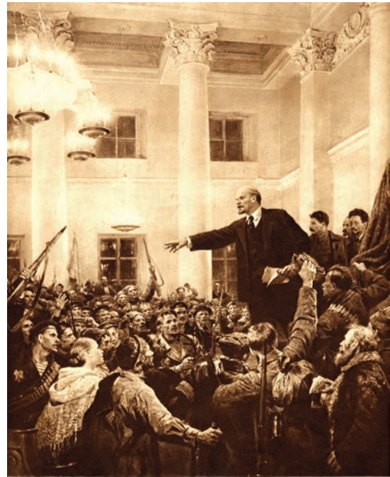
चित्र 9 - अप्रैल 1917 में मज़दूरों को संबोधित करते लेनिन की एक बोल्शेविक छवि.

गांवों में किसान और उनके समाजवादी क्रांतिकारी नेता भूमि पुनर्वितरण के लिए दबाव डालने लगे थे। इस काम के लिए भूमि समितियाँ बना दी गई थीं। सामाजिक क्रांतिकारियों से प्रेरणा और प्रोत्साहन लेते हुए जुलाई से सितंबर के बीच किसानों ने बहुत सारी ज़मीन पर कब्ज़ा कर लिया।