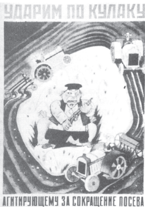
चित्र 18 - सामूहिकीकरण के दौर का एक पोस्टर। इसमें लिखा है : 'हम खेती में कमी लाने वाले कुलक पर वार करेंगे।'

वी. सोकोलोव (सं.), ऑब्श्चेस्त्वो I व्लास्त, वी 1930-ये गोदी (मास्को, 1997)।