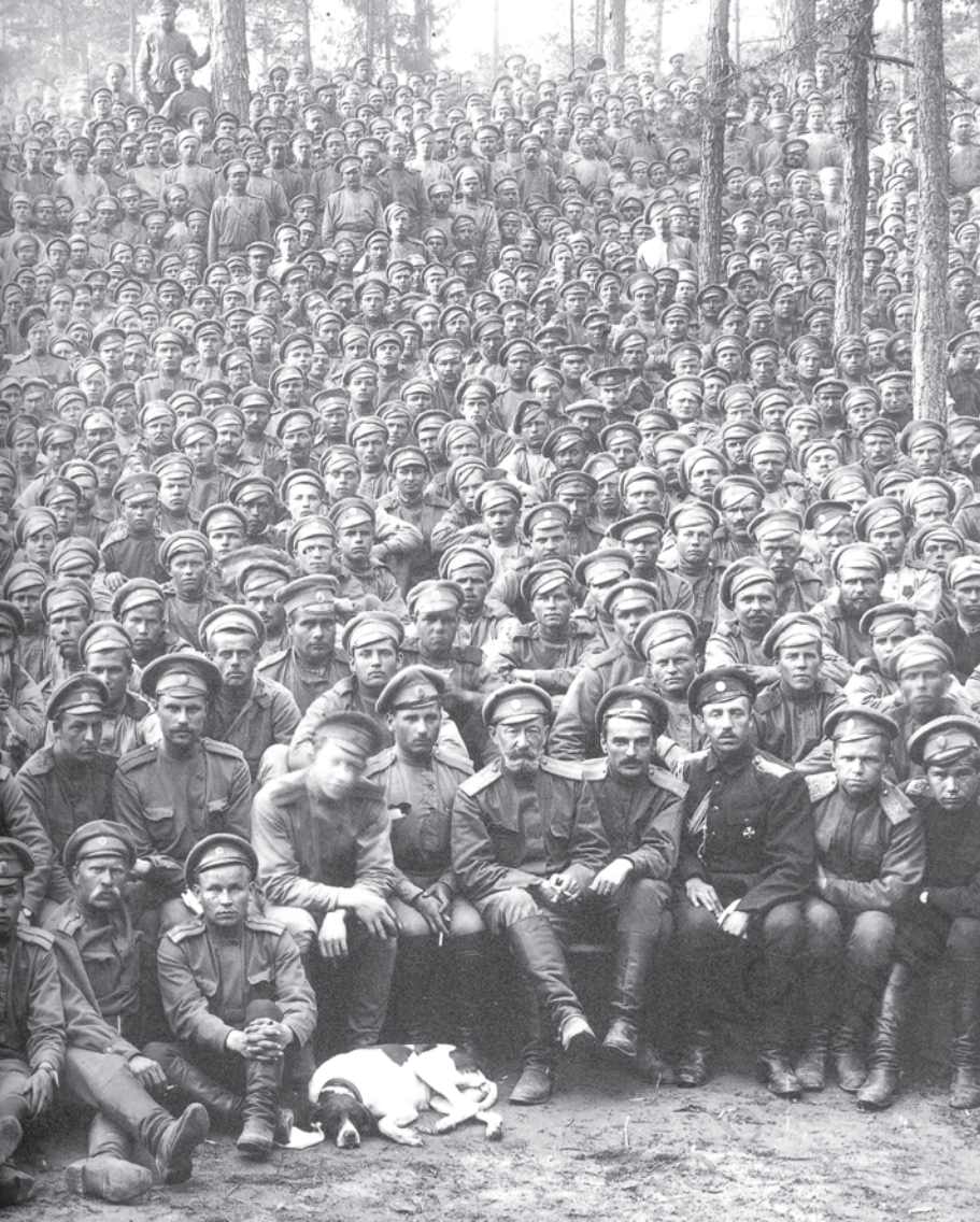
चित्र 7 - पहले विश्वयुद्ध के दौरान रूसी सिपाही . शाही रूसी सेना को 'रूसी स्टीमरोलर' कहा जाता था। यह दुनिया की सबसे बड़ी सशस्त्र सेना थी। जब इस सेना ने अपनी निष्ठा बदल कर क्रांतिकारियों को समर्थन देना शुरू कर दिया तो ज़ार की सत्ता भी ढह गई।

युद्ध से उद्योगों पर भी बुरा असर पड़ा। रूस के अपने उद्योग तो वैसे भी बहुत कम थे, अब तो बाहर से मिलने वाली आपूर्ति भी बंद हो गई क्योंकि बाल्टिक समुद्र में जिस रास्ते से विदेशी औद्योगिक सामान आते थे उस पर जर्मनी का कब्जा हो चुका था। यूरोप के बाकी देशों के मुकाबले रूस के औद्योगिक उपकरण ज़्यादा तेजी से बेकार होने लगे। 1916 तक रेलवे लाइनें टूटने लगीं। अच्छी सेहत वाले मर्दों को युद्ध में झोंक दिया गया। देश भर में मज़दूरों की कमी पड़ने लगी और ज़रूरी सामान बनाने वाली छोटी-छोटी वर्कशॉप्स ठप्प होने लगीं। ज़्यादातर अनाज सैनिकों का पेट भरने के लिए मोर्चे पर भेजा जाने लगा। शहरों में रहने वालों के लिए रोटी और आटे की किल्लत पैदा हो गई। 1916 की सर्दियों में रोटी की दुकानों पर अकसर दंगे होने लगे।