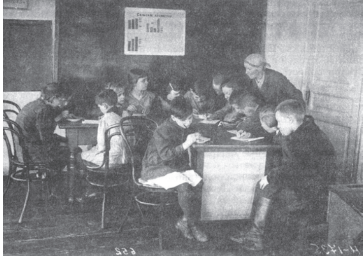
चित्र 15 - तीस के दशक में सोवियत रूस के एक स्कूल में पढ़ते बच्चे. बच्चे सोवियत अर्थव्यवस्था का अध्ययन कर रहे हैं।