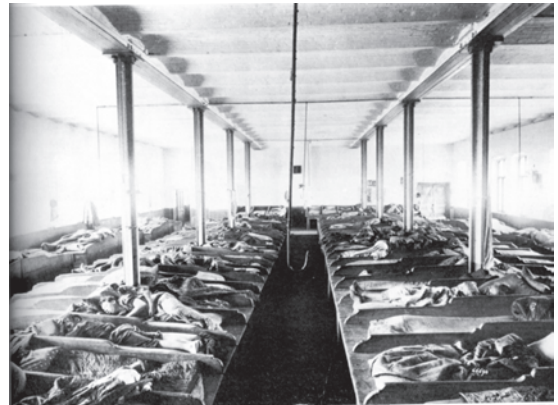
चित्र 6 - क्रांति-पूर्व रूस में एक डॉर्मिटरी में बने बंकर में सोते मजदूर. वे पालियों में बारी-बारी से सोते थे और परिवार को साथ नहीं रख सकते थे।