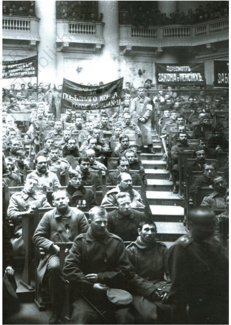
चित्र 8 - ड्यूमा में पेत्रोग्राद सोवियत की बैठक, फरवरी 1917 .

बॉक्स 2 देखें और वर्तमान कैलेंडर के हिसाब से अंतर्राष्ट्रीय महिला दिवस की तिथि का पता लगाएँ।