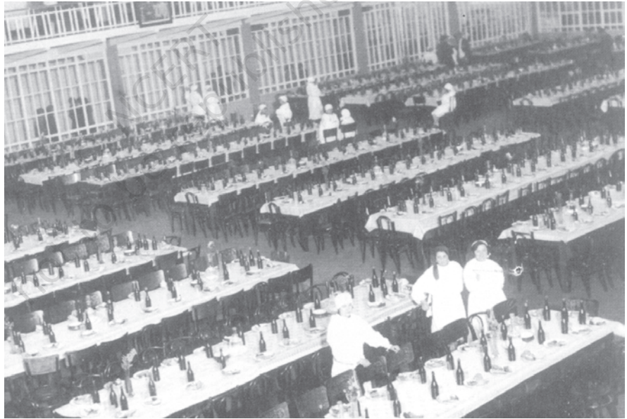
चित्र 17 - तीस के दशक में एक कारखाने का भोजन कक्ष.