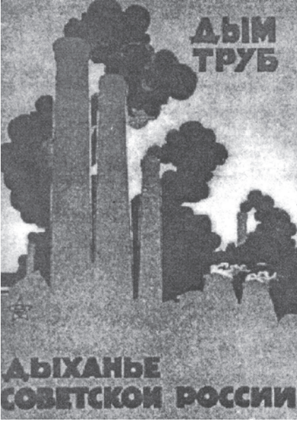
चित्र 14 - कारखानों को समाजवाद के प्रतीक की तरह माना जाता था. पोस्टर में लिखा है: 'चिमनियों से निकलता धुआँ ही सोवियत रूस की साँस है।'