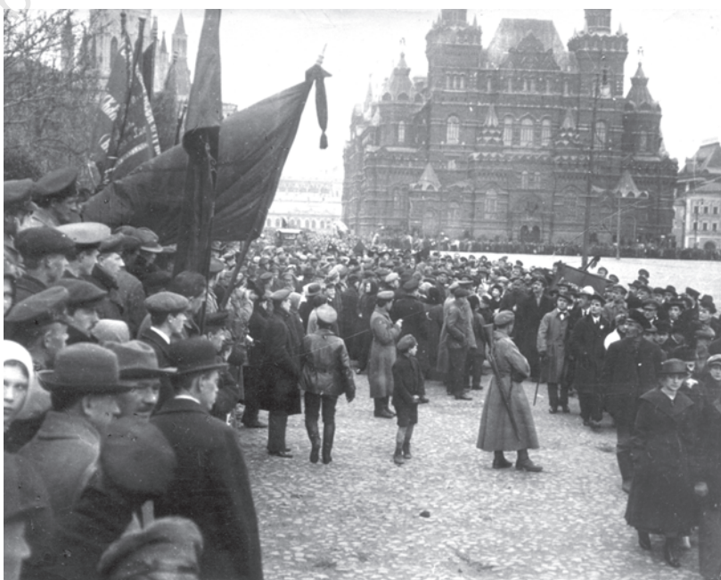
चित्र 13 - मास्को में मई दिवस का प्रदर्शन, 1918.