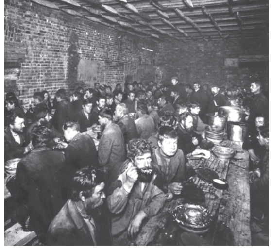
चित्र 5 - युद्ध से पहले सेंट पीटर्सबर्ग में बेरोज़गार किसान. बहुत सारे लोग धर्मार्थ लंगरों में खाना खाते थे और खस्ताहाल मकानों में रहते थे।

सामाजिक स्तर पर मजदूर बँटे हुए थे। कुछ मजदूर अपने मूल गाँवों के साथ अभी भी गहरे संबंध बनाए हुए थे। बहुत सारे मजदूर स्थायी रूप से शहरों में ही बस चुके थे। उनके बीच योग्यता और दक्षता के स्तर पर भी काफी फ़र्क था। सेंट पीटर्सबर्ग के एक धातु मजदूर ने कहा था : 'धातुकर्मी मजदूरों में खुद को साहब मानते थे। उनके काम में ज्यादा प्रशिक्षण और निपुणता की जरूरत जो रहती थी...।' 1914 में फैक्ट्री मजदूरों में औरतों की संख्या 31 प्रतिशत थी लेकिन उन्हें पुरुष मजदूरों के मुकाबले कम वेतन मिलता था (मर्दों की तनखाह के मुकाबले आधे से तीन-चौथाई तक)। मजदूरों के बीच मौजूद फ़ासला उनके पहनावे और व्यवहार में भी साफ़ दिखाई देता था। यद्यपि कुछ मजदूरों ने बेरोज़गारी या आर्थिक संकट के समय एक-दूसरे की मदद करने के लिए संगठन बना लिए थे लेकिन ऐसे संगठन बहुत कम थे।