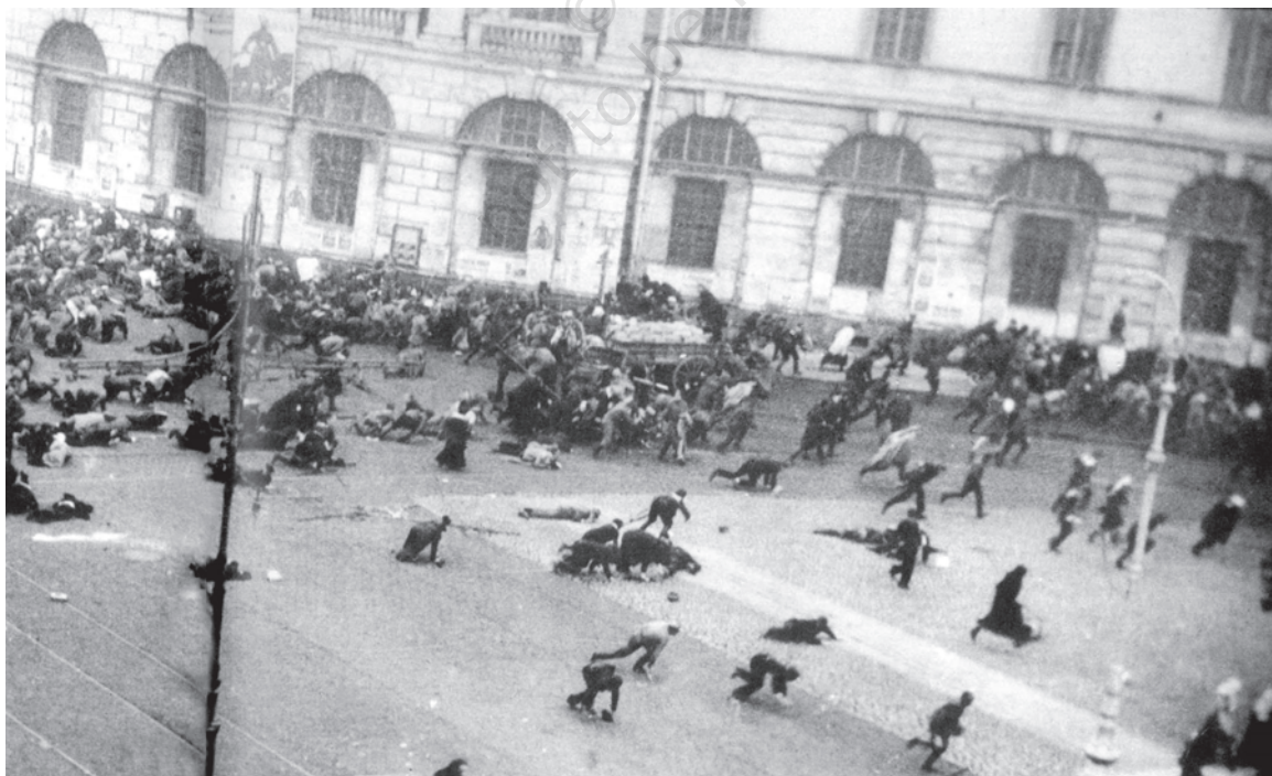
चित्र 10 - जुलाई के दिन.

17 जुलाई 1917 को बोल्शेविक समर्थक प्रदर्शनकारियों पर सेना द्वारा गोलीबारी का दृश्य।