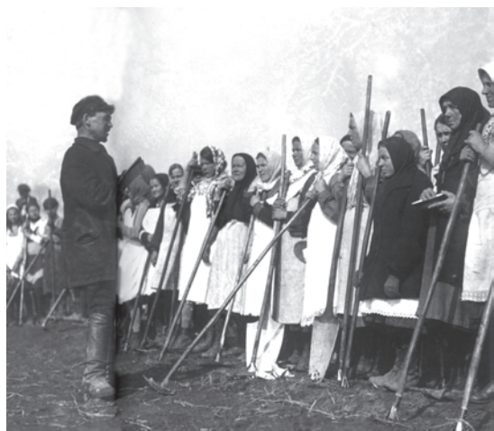
चित्र 19 - विशाल सामूहिक फ़ार्मों में काम करने के लिए जुटी किसान औरतें.

वी. सोकोलोव (सं.), ऑब्सचेस्त्वो I व्लास्त, वी 1930-ये गोदी।