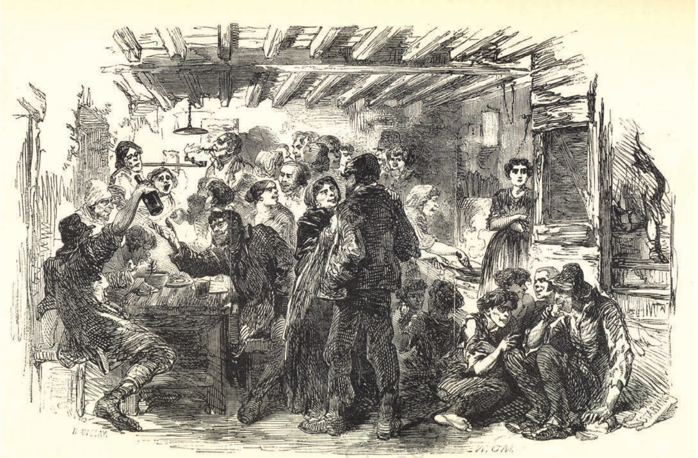
चित्र 1 - उन्नीसवीं शताब्दी के मध्य में लंदन के गरीबों की दशा उसी समय के एक व्यक्ति की दृष्टि से.

स्रोत : हेनरी मेह्यू, लंदन लेबर ऐन्ड लंदन पुअर, 1861