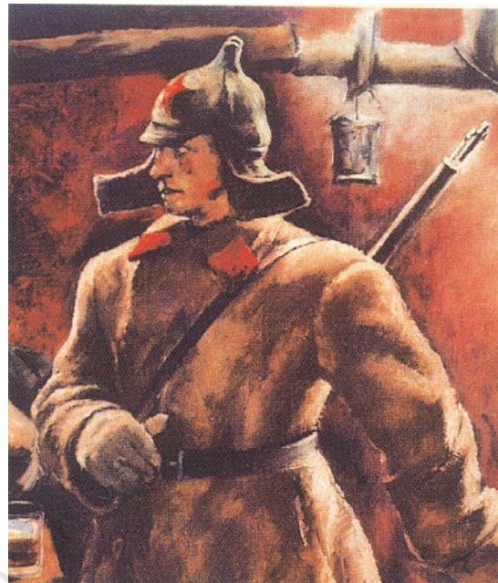
चित्र 12 - सोवियत टोपी (बुदियोनोव्का) पहने एक सिपाही.

बोल्शेविक पार्टी का नाम बदल कर रूसी कम्युनिस्ट पार्टी (बोल्शेविक) रख दिया गया। नवंबर 1917 में बोल्शेविकों ने संविधान सभा के लिए चुनाव कराए लेकिन इन चुनावों में उन्हें बहुमत नहीं मिल पाया। जनवरी 1918 में असेंबली ने बोल्शेविकों के प्रस्तावों को खारिज कर दिया और लेनिन ने असेंबली बर्खास्त कर दी। उनका मत था कि अनिश्चित परिस्थितियों में चुनी गई असेंबली के मुकाबले अखिल रूसी सोवियत कांग्रेस कहीं ज़्यादा लोकतांत्रिक संस्था है। मार्च 1918 में अन्य राजनीतिक सहयोगियों की असहमति के बावजूद बोल्शेविकों ने ब्रेस्ट लिटोव्स्क में जर्मनी से संधि कर ली। आने वाले सालों में बोल्शेविक पार्टी अखिल रूसी सोवियत कांग्रेस के लिए होने वाले चुनावों में हिस्सा लेने वाली एकमात्र पार्टी रह गई। अखिल रूसी सोवियत कांग्रेस को अब देश की संसद का दर्जा दे दिया गया था। रूस एक-दलीय राजनीतिक व्यवस्था वाला देश बन गया। ट्रेड यूनियनों पर पार्टी का नियंत्रण रहता था। गुप्तचर पुलिस (जिसे पहले चेका और बाद में ओजीपीयू तथा एनकेवीडी का नाम दिया गया) बोल्शेविकों की आलोचना करने वालों को दंडित करती थी। बहुत सारे युवा लेखक और कलाकार भी पार्टी की तरफ़ आकर्षित हुए क्योंकि वह समाजवाद और परिवर्तन के प्रति समर्पित थी। अक्टूबर 1917 के बाद ऐसे कलाकारों और लेखकों ने कला और वास्तुशिल्प के क्षेत्र में नए प्रयोग शुरू किए। लेकिन पार्टी द्वारा थोपी गई सेंसरशिप के कारण बहुत सारे लोगों का पार्टी से मोह भंग भी होने लगा था।