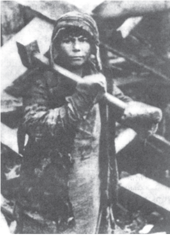
चित्र 16 - पहली पंचवर्षीय योजना के दौरान मैग्नीटोगोर्स्क का एक बच्चा. यह बच्चा सोवियत रूस के लिए काम कर रहा है।