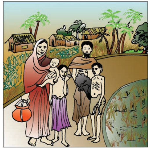
चित्र 4.2 : 1943 के बंगाल के अकाल के दौरान पूर्वी बंगाल के चटगाँव जिले में गाँव छोड़ कर जाता हुआ एक परिवार।