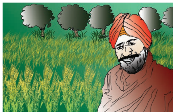
चित्र 4.3 : पंजाब का एक किसान एच.वाई.वी. प्रकारों वाले गेहूँ के एक खेत के सामने, जिस पर हरित क्रांति आधारित है

तत्कालीन प्रधानमंत्री इंदिरा गांधी ने जुलाई, 1968 में 'गेहूँ क्रांति' शीर्षक से एक विशेष डाक टिकट जारी कर कृषि के क्षेत्रक में हरित क्रांति की प्रभावशाली प्रगति को आधिकारिक रूप से दर्ज किया। गेहूँ की सफलता के बाद चावल के क्षेत्र में इस सफलता की पुनरावृत्ति हुई। बहरहाल, अनाज की उपज में वृद्धि समानुपातिक नहीं थी। उत्तर प्रदेश और मध्य प्रदेश में