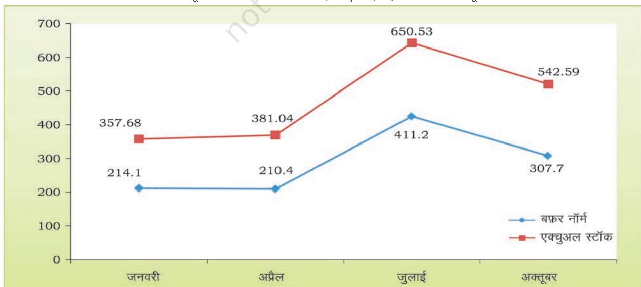
आरेख 4.2 : न्यूनतम बफ़र स्टॉक का स्तर (करोड़ टन) एवं चावल और गेहूँ के मानक

स्रोत : भारतीय खाद्य निगम, 2018; बफ़र स्टॉक का स्तर 1 जुलाई 2017 से माननीय है