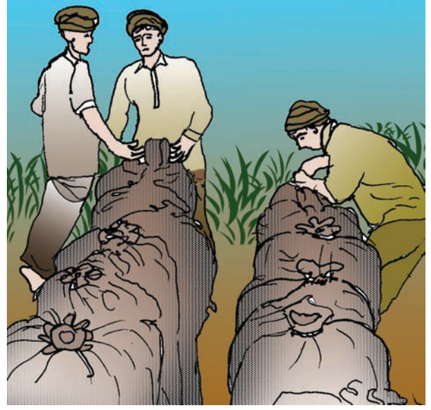
चित्र 4.5 : भंडारों में खाद्यान्न ले जाते हुए किसान

एन.एस.एस.ओ. न. 558 की रिपोर्ट के अनुसार ग्रामीण भारत में प्रति व्यक्ति चावल की खपत 6.38 किग्रा. वर्ष 2004-05 से घटकर 5.98 किग्रा. वर्ष 2011-12 में हो गया।