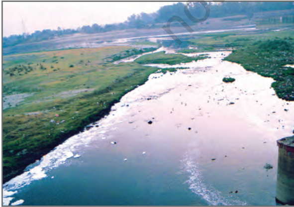
चित्र 2.8: यमुना नदी वाहित मल, औद्योगिक बहिःस्राव एवं कचरे के कारण प्रदूषित हो रही है

आज के विश्व में शुद्ध तथा पर्याप्त जल स्रोतों तक पहुँचना एक बड़ी समस्या बन गई है। इस क्षीण होते संसाधन के संरक्षण के लिए कदम उठाने चाहिए। यद्यपि जल एक नवीकरणीय संसाधन है तथापि इसका