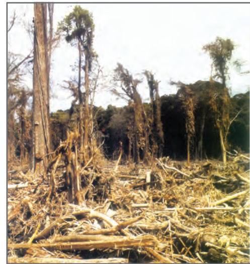
चित्र 2.16: सुनामी के पश्चात ग्रेट निकोबार के वर्षा-प्रचुर वन में क्षति

भूमि, मृदा, जल, प्राकृतिक वनस्पति और वन्य जीवन संसाधन 17