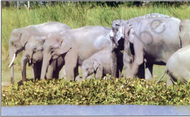
चित्र 2.19: काजीरंगा राष्ट्रीय उद्यान में हाथियों का झुंड