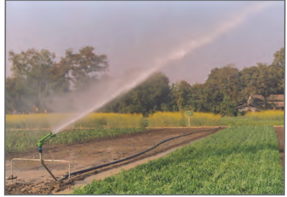
चित्र 2.9: सिंचकलर

प्राकृतिक वनस्पति और वन्य जीवन केवल स्थलमंडल, जलमंडल और वायुमंडल के बीच जुड़े एक सँकरे क्षेत्र में ही पाए जाते हैं जिसे हम जैवमंडल कहते हैं। जैवमंडल में