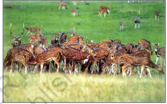
चित्र 2.18: चीतलों का झुंड

एक अंतर्राष्ट्रीय परिपाटी सी.आई.टी.ई.एस. (द कन्वेंशन ऑन इंटरनेशनल ट्रेड इन इनडेंजर्ड स्पीशीस ऑफ वाइल्ड फौना एंड फ्लौरा) की स्थापना की गई है जिसने प्राणियों और पक्षियों की अनेक जातियों की सूची तैयार की है। इस सूची में दिए गए सभी पक्षियों और प्राणियों के व्यापार करने पर प्रतिबंध लगाया गया है। पौधों और प्राणियों का संरक्षण प्रत्येक नागरिक का नैतिक कर्तव्य है।