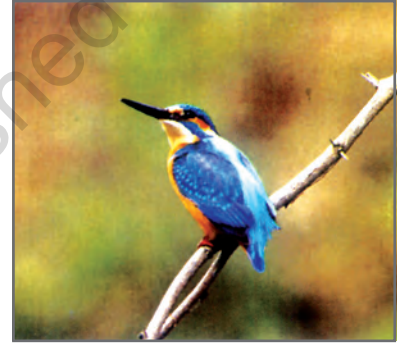
चित्र 2.12: किलकिला (किंग फिशर)