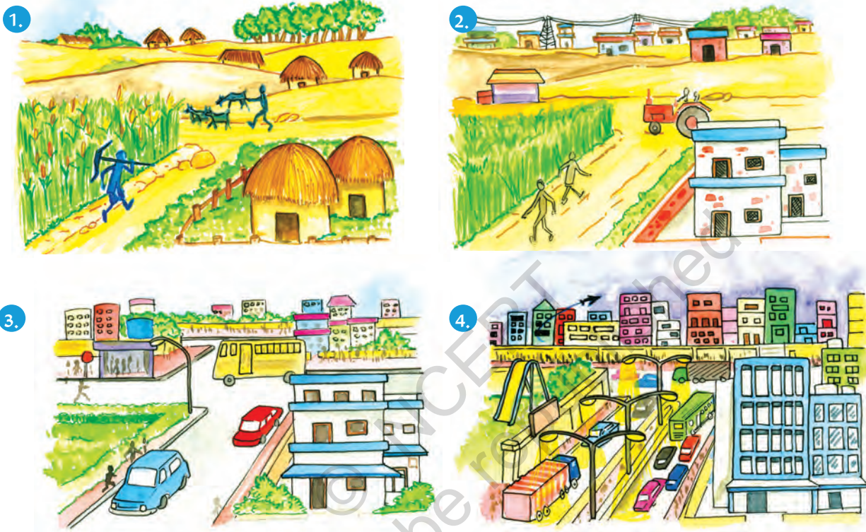
चित्र 2.2: भूमि उपयोग में समय के अनुसार परिवर्तन

प्रतिरूप में व्यापक परिवर्तन हमारे समाज में सांस्कृतिक परिवर्तनों को दर्शाते हैं। वर्तमान में कृषि और निर्माण सम्बन्धी गतिविधियों के प्रसार के कारण निम्नीकरण, भूस्खलन, मृदा अपरदन, मरुस्थलीकरण पर्यावरण के लिए प्रमुख खतरा है।