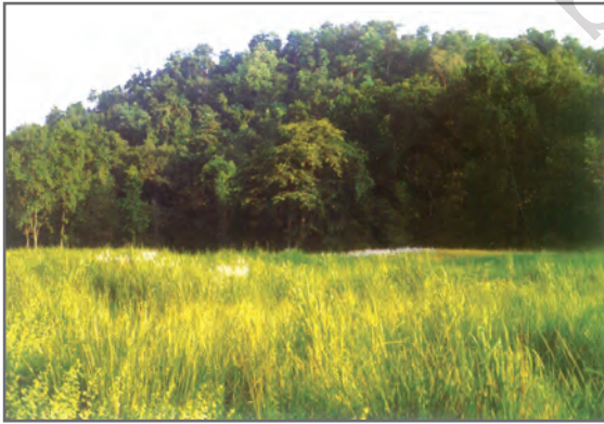
चित्र 2.13: घास स्थल एवं वन

सभी जीवित जातियाँ जीवित रहने के लिए एक-दूसरे से परस्पर संबंधित और निर्भर रहती हैं। इस जीवन आधारित तंत्र को पारितंत्र कहते हैं। वनस्पति और वन्य जीवन बहुमूल्य संसाधन हैं। पौधे हमें इमारती लकड़ी देते हैं, प्राणियों को आश्रय देते हैं, ऑक्सीजन उत्पन्न करते हैं जिसमें हम साँस लेते हैं, फसलों को उगाने के लिए आवश्यक मृदा की सुरक्षा करते हैं, रक्षक मेखला के रूप में कार्य करते हैं, भूमिगत जल के संग्रह में सहायता करते हैं, हमें फल, लैटेक्स, तारपीन का तेल, गोंद, औषधीय पौधे और कागज प्रदान करते हैं जो आपके अध्ययन के लिए अत्यधिक आवश्यक है। पौधों के असंख्य उपयोग हैं उनमें आप कुछ और जोड़ सकते हैं।