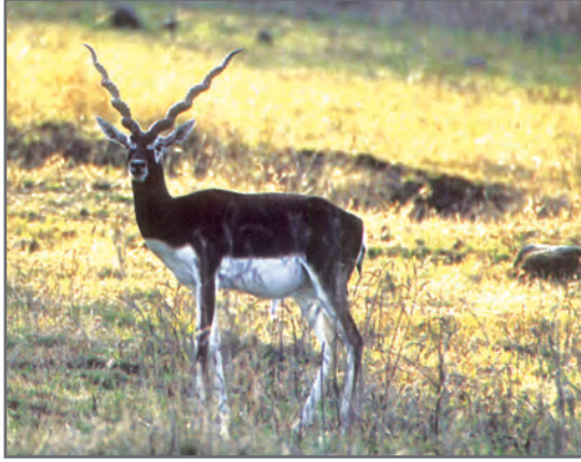
चित्र 2.17: ब्लैकबक को सुरक्षा की आवश्यकता है

में तेजी से कमी आई है। पशु खाल, चमड़ा, नाखून, दाँत और पंखों के साथ-साथ सींगों के एकत्रीकरण और गैर-कानूनी व्यापार के लिए जंतुओं का अनाधिकार शिकार किया गया है। इनमें से कुछ जंतु चीता, शेर, हाथी, ब्लैकबक, मगरमच्छ, दरियाई घोड़ा, हिम तेंदुआ, शुतुरमुर्ग और मोर हैं। इनका संरक्षण जागरूकता बढ़ाकर किया जा सकता है।