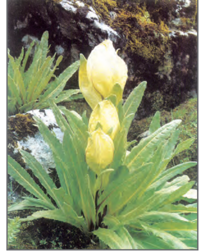
चित्र 2.11: ब्रह्मकमल—एक औषधीय बूटी

मधुमक्खी हमें शहद देती हैं, फूलों के परागण में मदद करती है और पारितंत्र में अपघटक के रूप में एक महत्वपूर्ण भूमिका निभाती हैं। चिड़ियाँ अपने भोजन के लिए कीटों पर निर्भर हैं और अपघटकों के रूप में कार्य करती हैं। गिद्ध मृत जीव-जंतुओं को खाने के कारण एक अपमार्जक है और पर्यावरण का एक महत्वपूर्ण शोधक समझा जाता है। इसलिए प्राणी चाहे बड़े हों अथवा छोटे सभी पारितंत्र के संतुलन को बनाए रखने के लिए अनिवार्य हैं।