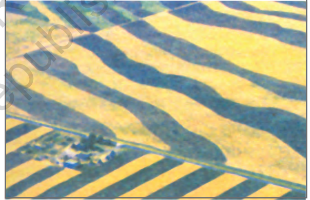
चित्र 2.6: समोच्चरेखीय जुताई