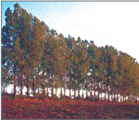
चित्र 2.7: रक्षक मेखला

वेदिका फार्म : चौड़े, समतल सोपान अथवा वेदिका तीव्र ढालों पर बनाए जाते हैं ताकि सपाट सतह फसल उगाने के लिए उपलब्ध हो जाए। इनसे पृष्ठीय प्रवाह और मृदा अपरदन कम होता है (चित्र 2.5)।