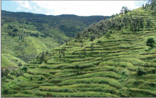
चित्र 2.5: वेदिका फार्म

मल्च बनाना : पौधों के बीच अनावरित भूमि जैव पदार्थ जैसे प्रवाल से ढक दी जाती है। इससे मृदा की आर्द्रता रुकी रहती है।