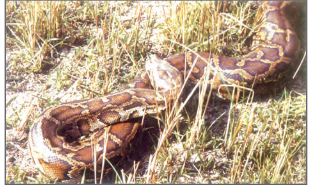
चित्र 2.14: वन में अजगर

वन हमारी संपदा है। पौधे जंतुओं को आश्रय प्रदान करते हैं और साथ ही पारितंत्र को भी अनुरक्षित रखते हैं। जलवायु में परिवर्तन और मानव हस्तक्षेप के कारण पौधों और जंतुओं के प्राकृतिक आवास नष्ट हो सकते हैं। बहुत-सी जातियाँ असुरक्षित अथवा संकटापन्न हैं और कुछ लुप्त होने के कगार पर हैं। वनोन्मूलन, मृदा अपरदन, निर्माण कार्य, दावानल और भूस्खलन में से कुछ मानव और प्राकृतिक कारक हैं जो मिलकर इन महत्वपूर्ण प्राकृतिक संसाधनों के लुप्त होने की प्रक्रिया को बढ़ावा देते हैं। आज की मुख्य चिंताओं में से एक अनाधिकार शिकार करने की संख्या का बढ़ना है जिससे कुछ खास प्रजातियों की संख्या