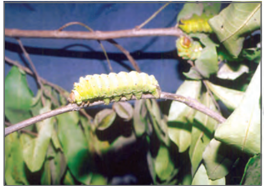
चित्र 2.10: रेशमकीट

अपने घर की छत पर वर्षा जल एकत्र करके, इस जल का संग्रहण करना एवं विभिन्न उत्पादक उपयोगों में लाना वर्षा जल संग्रहण कहलाता है। औसतन दो घंटे की वर्षा का एक दौर 8,000 लीटर जल बचाने के लिए काफी है।