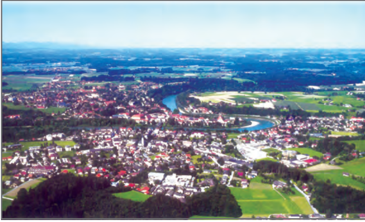
चित्र 2.1: ऑस्ट्रिया में साल्ज़बर्ग

इस चित्र में आप भूमि के कितने उपयोग पहचान सकते हैं?