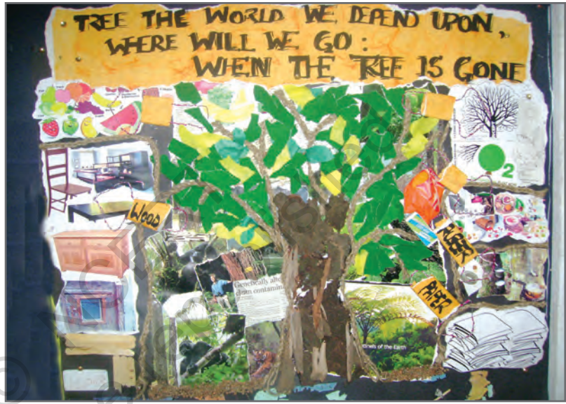
चित्र 2.15: स्कूल में छात्रों द्वारा वनों पर बनाया गया कोलाज