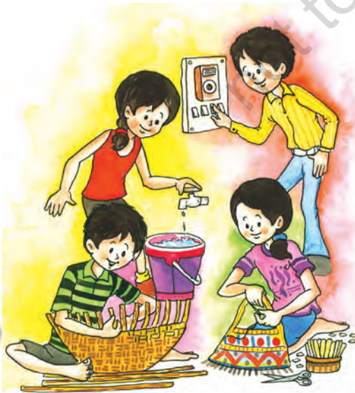
4 संसाधन एवं विकास

सततपोषणीय विकास संसाधनों का सावधानीपूर्वक उपयोग ताकि न केवल वर्तमान पीढ़ी की अपितु भावी पीढ़ियों की आवश्यकताएँ भी पूरी होती रहें।