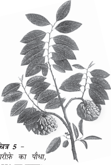
चित्र 5 - शरीफे का पौधा, 1770 का दशक।

अंग्रेजों द्वारा बनाए गए वानस्पतिक उद्यान और प्राकृतिक इतिहास के संग्रहालयों में विभिन्न पौधों के नमूने और उनसे संबंधित जानकारीयों इकट्ठा की जाती थीं। इन नमूनों के चित्र स्थानीय कलाकारों से बनवाए जाते थे। अब इतिहासकार इस बात पर ध्यान दे रहे हैं कि इस तरह की जानकारी किस तरह इकट्ठा की जाती थी और इससे उपनिवेशवाद के बारे में क्या पता चलता है।