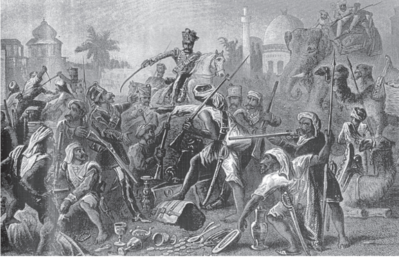
चित्र 7 - 1857 के विद्रोही।

तसवीरों को भी बहुत ध्यान से देखना चाहिए। उनसे हमें चित्रकार की सोच पता चलती है। 1857 के विद्रोह के बाद अंग्रेजों द्वारा तैयार की गई सचित्र पुस्तकों में यह तसवीर कई जगह दिखाई देती है। इस तसवीर के नीचे लिखा होता था : “बागी सिपाही लूट-खसोट में लगे हुए हैं”। अंग्रेजों की नज़र में विद्रोही जनता लालची, दुष्ट और बेरहम थी। इस विद्रोह के बारे में आप अध्याय 5 में पढ़ेंगे।