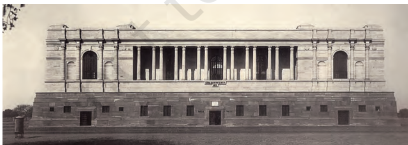
चित्र 4 - भारतीय राष्ट्रीय अभिलेखागार 1920 के दशक में बनाया गया।

उन्हें खुशनवीसी के माहिर लिखते थे। खुशनवीसी या सुलेखनवीस ऐसे लोग होते हैं जो बहुत सुंदर ढंग से चीजें लिखते हैं। उन्नीसवीं सदी के मध्य तक छपाई