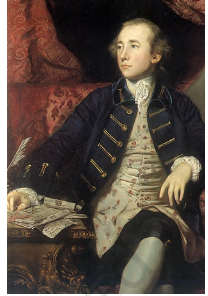
चित्र 3 - वॉरेन हेस्टिंग्स 1773 में भारत के पहले गवर्नर-जनरल बने।

मिल को लगता था कि सारे एशियाई समाज सभ्यता के मामले में यूरोप से पीछे हैं। इतिहास की उनकी समझदारी ये थी कि भारत में अंग्रेजों के आने से पहले यहाँ हिंदू और मुसलमान तानाशाहों का ही राज चलता था। यहाँ चारों ओर केवल धार्मिक बैर, जातिगत बंधनों और अंधविश्वासों का ही बोलबाला