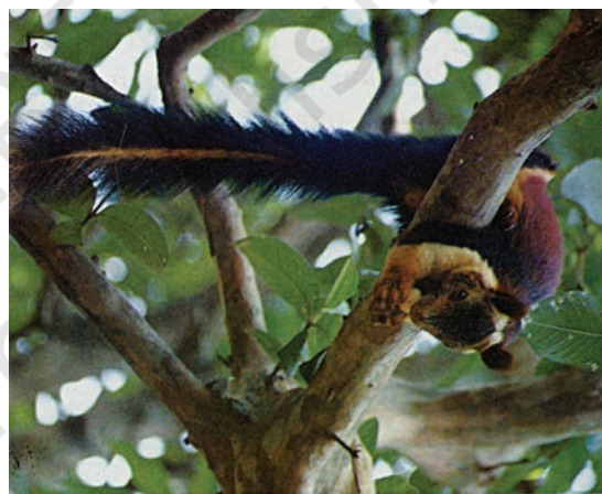
चित्र 7.3(b) : विशाल गिलहरी।