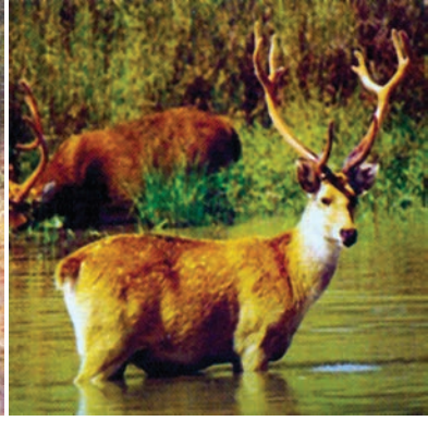
चित्र 7.6 : बारहसिंघा।