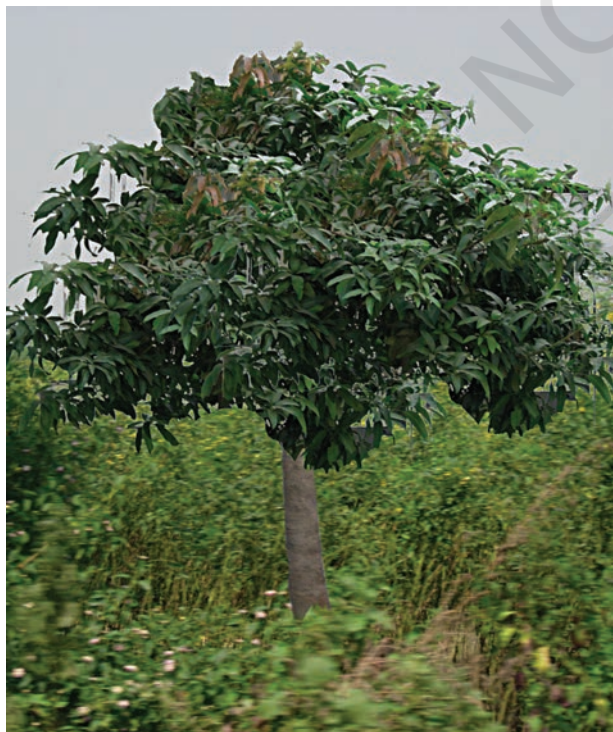
चित्र 7.3(a) : जंगली आम।