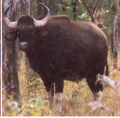
चित्र 7.5 : जंगली भैंसा।