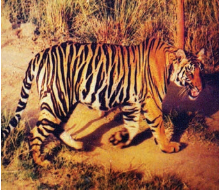
चित्र 7.4 : बाघ।