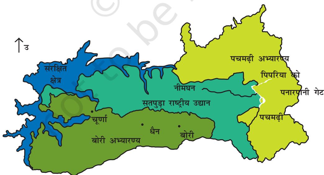
चित्र 7.1 : पचमढ़ी जैवमण्डल आरक्षित क्षेत्र।