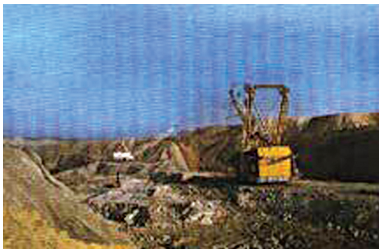
चित्र 5.2 : कोयले की एक खान।

वायु में गर्म करने पर कोयला जलता है और मुख्य रूप से कार्बन डाइऑक्साइड गैस उत्पन्न करता है।