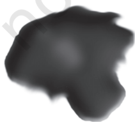
चित्र 5.3 : कोलतार।

यह एक अप्रिय गंध वाला काला गाढ़ा द्रव होता है (चित्र 5.3)। यह लगभग 200 पदार्थों का मिश्रण