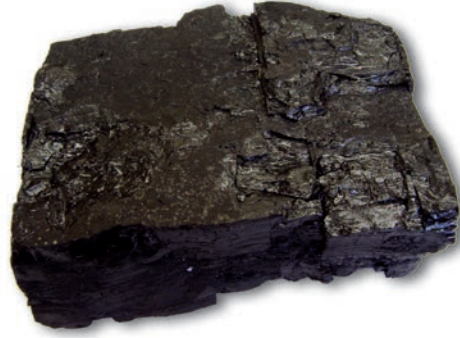
चित्र 5.1 : कोयला।

आपने कोयला देखा होगा या इसके बारे में सुना होगा (चित्र 5.1)। यह पत्थर जैसा कठोर और काले रंग का होता है।