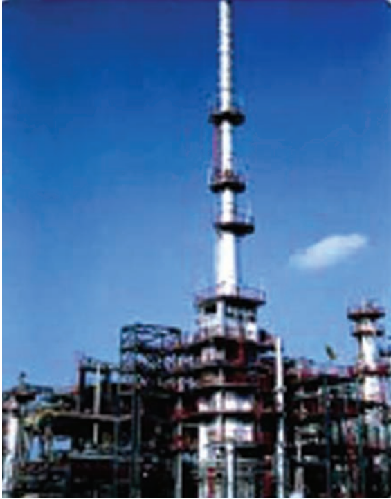
चित्र 5.5 : पेट्रोलियम परिष्करण।

को पृथक करने का प्रक्रम परिष्करण कहलाता है। यह कार्य पेट्रोलियम परिष्करण में सम्पादित किया जाता है (चित्र 5.5)।