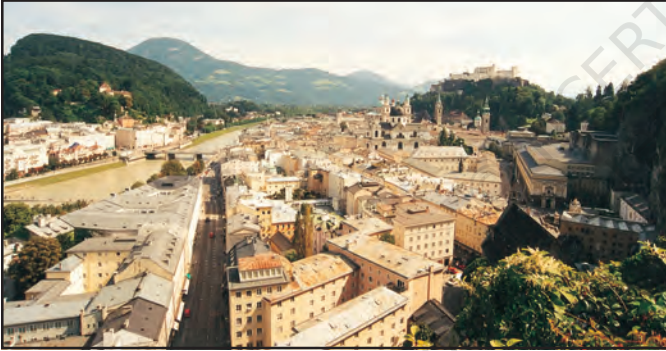
चित्र 7.2 : सघन बस्ती