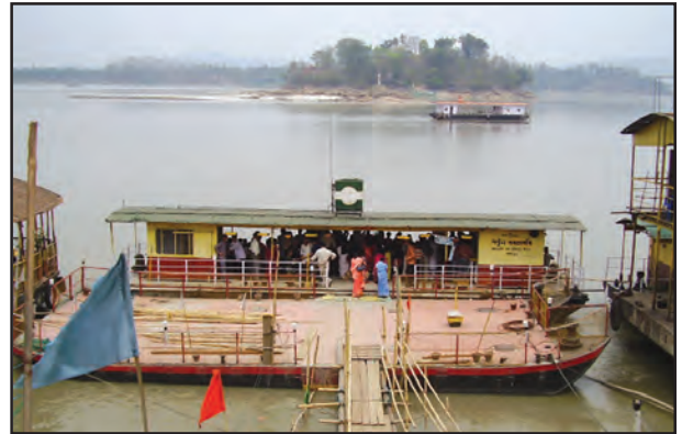
चित्र 7.8 : अंतर्देशीय जलमार्ग

समुद्री एवं महासागरीय मार्गों का उपयोग सामान्यतः व्यापारिक माल एवं समान को एक देश से दूसरे देश में पहुँचाने के लिए करते हैं। ये मार्ग पत्तनों से जुड़े होते हैं। विश्व के कुछ महत्वपूर्ण पत्तन हैं—एशिया में सिंगापुर एवं मुंबई, उत्तर अमेरिका में न्यूयॉर्क एवं लॉस एंजिल्स, दक्षिण अमेरिका में रियो डि जेनेरियो, अफ्रीका में डरबन एवं केपटाउन, आस्ट्रेलिया में सिडनी, यूरोप में लंदन (चित्र 7.11)। क्या आप विश्व के कुछ और पत्तनों के भी नाम बता सकते हैं?