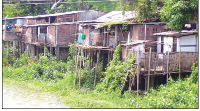
चित्र 7.4 : स्टिल्ट पर मकान

नगरीय बस्तियों में नगर छोटी एवं शहर उनसे बड़ी बस्तियाँ होती हैं। नगरीय क्षेत्रों में लोग निर्माण, व्यापार एवं सेवा क्षेत्रों में कार्यरत होते हैं। अपने राज्य के कुछ गाँवों, नगरों एवं शहरों के नाम लिखिए।