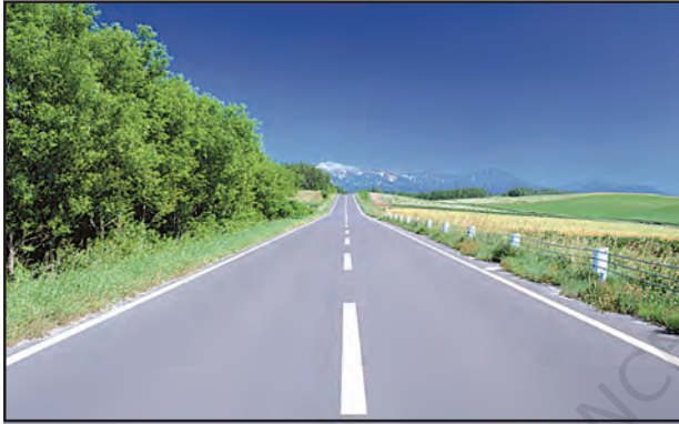
चित्र 7.6 : पक्की सड़क

कम दूरी यातायात के सबसे अधिक उपयोग किए जाने वाले मार्ग सड़क हैं। सड़कें पक्की एवं कच्ची हो सकती हैं (चित्र 7.6 एवं 7.7)। मैदानी क्षेत्रों में सड़कों का घना जाल बिछा है। मरुस्थलों, वनों एवं ऊँचे पर्वत जैसे स्थानों पर भी सड़कें बनी हुई हैं। हिमालय पर्वत पर मनाली-लेह राजमार्ग विश्व के सबसे ऊँचे सड़क मार्गों में से एक है। भूमिगत सड़कों को भूमिगत मार्ग (सब वे) कहते हैं। फ्लाईओवर, उत्थित संरचनाओं के ऊपर बनाए जाते हैं।