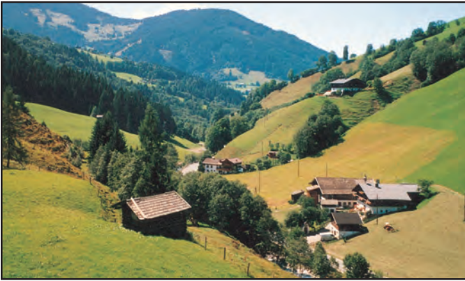
चित्र 7.3 : प्रकीर्ण बस्ती

मैरी का जन्मदिन था। केक काटने के लिए वह अपने मित्रों के साथ गुरप्रीत की प्रतीक्षा कर रही थी। आखिरकार थकी, खाँसती और हाँफती हुई गुरप्रीत पहुँची। उसने बताया कि अत्यधिक यातायात ज़ाम था। मैरी की माँ मिसेस थॉमस ने गुरप्रीत की पीठ थपथपाकर गहरी साँस भरी, “ओह!... हमारे शहर में बहुत प्रदूषण है!” प्रसाद हाल ही में गाँव से आया था। उसने पूछा, “शहरों में इतना प्रदूषण तथा यातायात ज़ाम क्यों होता है?” “शहरों में बढ़ती आबादी के कारण दिन-प्रतिदिन वाहनों की संख्या बढ़ती जा रही है,” मैरी के पिता मि. थॉमस ने कहा। मैरी ने पूछा, “तब लोग शहर क्यों आते हैं?” उसकी माँ ने उत्तर दिया, “वे यहाँ नौकरी, बेहतर शिक्षा एवं चिकित्सीय सुविधा की तलाश में आते हैं।” मैरी ने फिर पूछा, “यदि इतनी अधिक संख्या में लोग शहर में आते रहेंगे तो ये सारे लोग कहाँ रहेंगे?” मि. थॉमस ने कहा, “यही कारण है कि अत्यधिक संख्या में गंदी बस्तियाँ एवं अवैध कब्जे वाली बस्तियाँ दिखाई देती हैं, जहाँ लोग भीड़-भाड़ एवं अस्वास्थ्यकारी परिस्थितियों में रहते हैं। शहरों में जल एवं विद्युत की कमी एक सामान्य समस्या है।” प्रसाद ने कहा, “हमारे गाँव में बड़े सिनेमा घर, अच्छी सुविधाओं वाले स्कूल एवं अच्छे