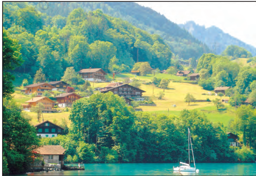
चित्र 7.1 : मानव बस्ती