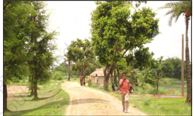
चित्र 7.7 : कच्ची सड़क