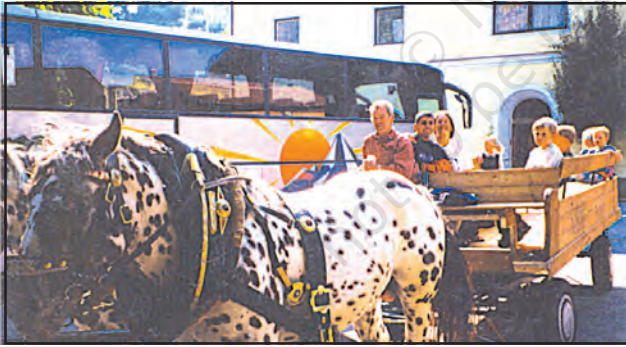
चित्र 7.5 : यातायात के साधन के रूप में घोड़ागाड़ी

परिवहन लोगों एवं सामान के आवागमन के साधन होते हैं। पुराने समय में अधिक दूरी की यात्रा करने में अत्यधिक समय लगता था। उस समय लोग पैदल चलते थे एवं अपने सामान को ढोने के लिए पशुओं का उपयोग करते थे। पहिए की खोज से परिवहन आसान हो गया। समय के साथ परिवहन के विभिन्न साधनों का विकास होता गया, लेकिन आज भी लोग परिवहन के लिए पशुओं का उपयोग करते हैं (चित्र 7.5)।