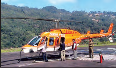
चित्र 7.9 : हेलीकॉप्टर

बीसवीं सदी के आरंभ में विकसित यह परिवहन का सबसे तीव्र मार्ग है। ईंधन की लागत अधिक होने के कारण यह सर्वाधिक महंगा साधन है। वायु यातायात खराब मौसम, जैसे-कुहरे एवं तूफान से कुप्रभावित होता है। यह यातायात का अकेला साधन है, जो सर्वाधिक दुर्गम एवं दुरूह स्थानों तक पहुँच सकता है, विशेष रूप से जहाँ सड़क एवं रेलमार्ग नहीं हैं। हेलीकॉप्टर अगम्य स्थानों एवं संकटकालीन स्थितियों में लोगों को बचाने एवं भोजन, जल, कपड़े एवं दवाएँ बाँटने के लिए एक बहुत ही उपयोगी साधन है (चित्र 7.9)। कुछ महत्वपूर्ण हवाई पत्तन हैं : दिल्ली, मुंबई, न्यूयॉर्क, लंदन, पेरिस, फ्रैंकफर्ट एवं काहिरा (चित्र 7.11)।