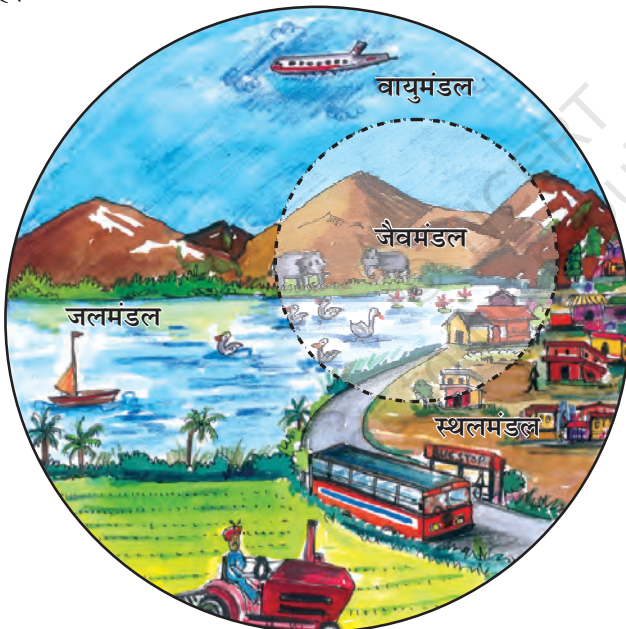
चित्र 1.2 : पर्यावरण के क्षेत्र

स्थलमंडल वह क्षेत्र है, जो हमें वन, कृषि एवं मानव बस्तियों के लिए भूमि, पशुओं को चरने के लिए घासस्थल प्रदान करता है। यह खनिज संपदा का भी एक स्रोत है।