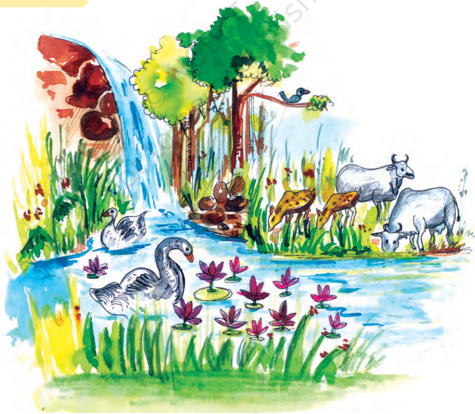
चित्र 1.3 : एक ताल का पारितंत्र

तभी जैसलमेर के रहने वाले हीरा ने आश्चर्य से कहा, “हमारे यहाँ वर्षा होती ही नहीं है। हमें तो दूर-दूर तक केवल कीकर एवं रेत ही नज़र आती है।” “लेकिन वहाँ ऊँट भी तो मिलते हैं,” रवि ने कहा।