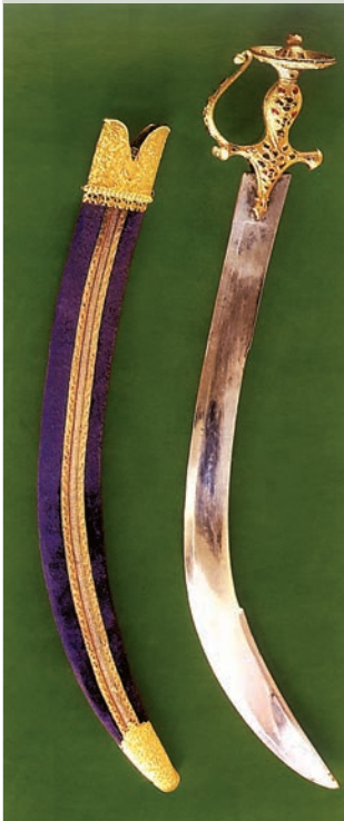
चित्र 7 महाराजा रणजीत सिंह की तलवार

खालसा से क्या अभिप्राय है? क्या आपको याद है कि इसके बारे में आपने अध्याय 8 में पढ़ा है?