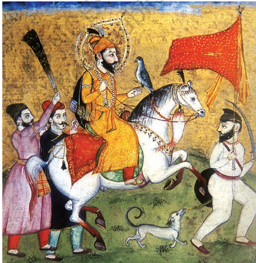
चित्र 6 दसवें गुरु, गुरु गोबिंद सिंह

अठारहवीं शताब्दी में कई योग्य नेताओं के नेतृत्व में सिक्खों ने अपने-आपको पहले 'जत्थों' में, और बाद में 'मिस्तों' में संगठित किया। इन जत्थों और मिस्तों की संयुक्त सेनाएँ 'दल खालसा' कहलाती थीं। उन दिनों दल खालसा, बैसाखी और दीवाली के पर्वों पर अमृतसर में मिलता था। इन बैठकों में वे सामूहिक निर्णय लिए जाते थे, जिन्हें गुरुमत्ता (गुरु के प्रस्ताव) कहा जाता था। सिक्खों ने राखी व्यवस्था स्थापित की, जिसके