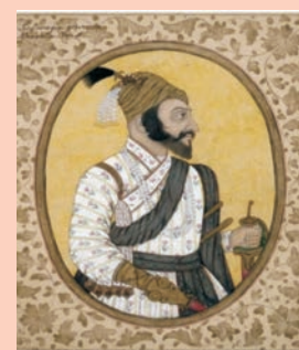
चित्र 7a शिवाजी का रूपचित्र

पेशवाओं की देखरेख में मराठों ने एक अत्यंत सफल सैन्य संगठन का विकास कर लिया। उनकी सफलता का रहस्य यह था कि वे मुगलों के किलाबंद इलाकों से टक्कर न लेते हुए, उनके पास से चुपचाप निकलकर शहरों-कस्बों पर हमला बोलते थे और मुगल सेना से ऐसे मैदानी इलाकों में मुठभेड़ लेते थे; जहाँ रसद पाने और कुमक आने के रास्ते आसानी से रोके जा सकते थे।