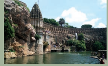
चित्र 4a चित्तौड़गढ़ किला, राजस्थान

कई राजपूत सरदारों ने पहाड़ियों की चोटियों पर किले बनाये, जो सत्ता के केंद्र बने। व्यापक किलेबंदी के साथ इन भव्य संरचनाओं में नगर, महलें, मंदिर, व्यापारिक केंद्र, जल संग्रहण संरचनाएं और अन्य इमारतें होती थीं। चित्तौड़गढ़ किले में, तालाब, कुण्डी (कुएं), बावली जैसे कई जल निकाय थे।