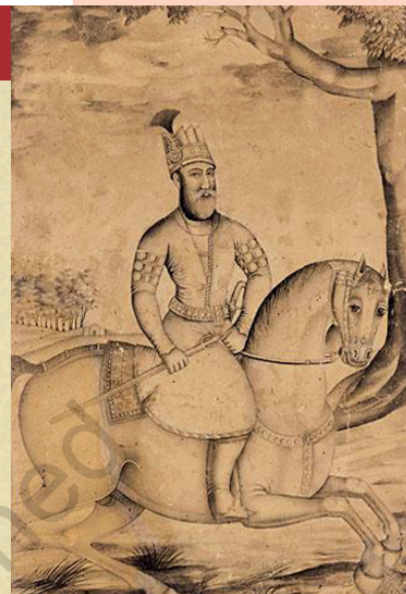
चित्र 1 नादिरशाह का 1779 का एक चित्र