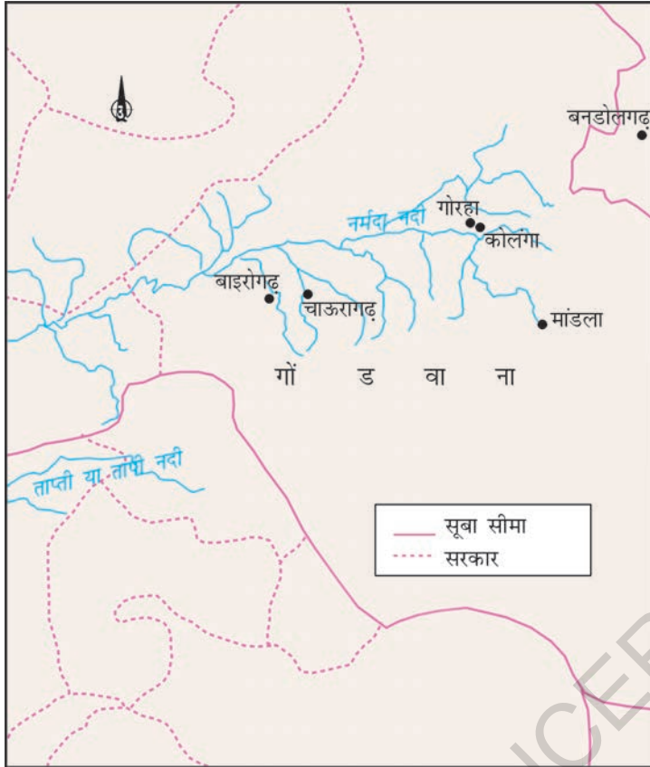
मानचित्र 2 गोंडवाना

दलपत की मृत्यु कम उम्र में ही हो गई। रानी दुर्गावती बहुत योग्य थी और उसने अपने पाँच साल के पुत्र बीर नारायण के नाम पर शासन की कमान सँभाली। उसके समय में राज्य का और अधिक विस्तार हुआ। 1565 में आसिफ़ खान के नेतृत्व में मुग़ल सेनाओं ने गढ़ कटंगा पर हमला किया। रानी दुर्गावती ने इसका जम कर सामना किया। उसकी हार हुई और उसने समर्पण करने की बजाय मर जाना बेहतर समझा। उसका पुत्र भी तुरंत बाद लड़ता हुआ मारा गया।