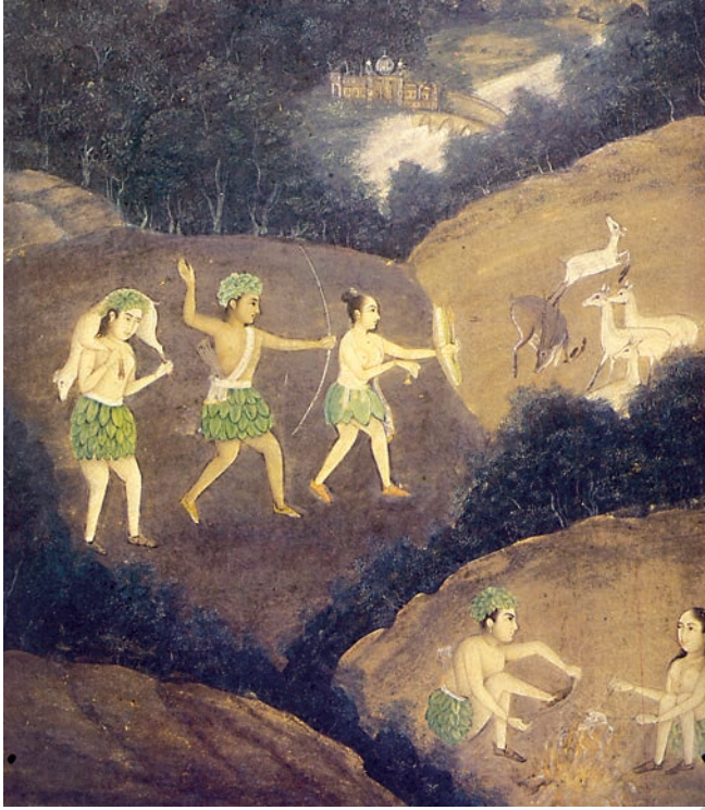
चित्र 2 : रात में भील लोग हिरन का शिकार कर रहे हैं।