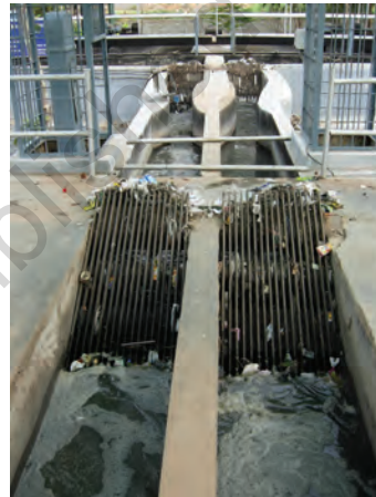
चित्र 18.3 शलाका छन्ने