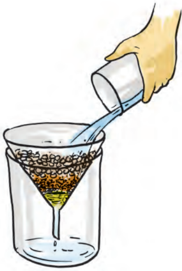
चित्र 18.2 वातित द्रव को फ़िल्टर करने का प्रक्रम