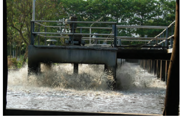
चित्र 18.6 वातित्र

कई घंटों के पश्चात् जल में निलंबित सूक्ष्मजीव टंकी की पेंदी में सक्रिय आपंक के रूप में बैठ जाते हैं। अब शीर्ष भाग से जल को निकाल दिया जाता है। सक्रिय आपंक लगभग 97% जल है। जल को बालू बिछाकर बनाए शुष्कन तलों अथवा मशीनों द्वारा हटा दिया जाता है। शुष्क आपंक का उपयोग खाद के रूप में किया जाता है, जिससे कार्बनिक पदार्थ और पोषक तत्व पुनः मृदा में वापस चले जाते हैं।