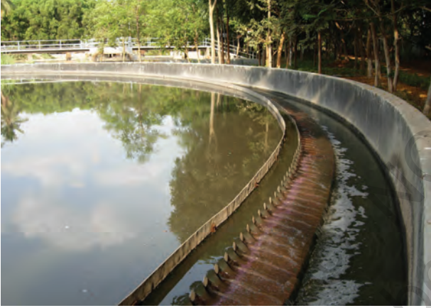
चित्र 18.5 जल अपमथित्र

आपंक को एक पृथक् टंकी में स्थानांतरित किया जाता है, जहाँ यह अवायवीय जीवाणुओं द्वारा अपघटित हो जाता है। इस प्रक्रम में उत्पन्न होने वाली बायोगैस (जैव गैस) का उपयोग ईंधन के रूप में अथवा विद्युत उत्पादन के लिए किया जा सकता है।