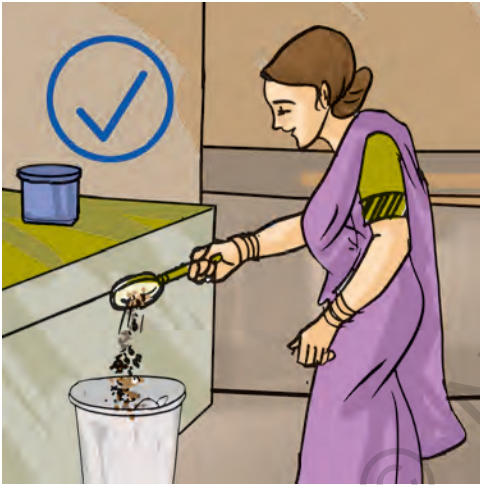
चित्र 18.7 हर कचरे को सिंक में मत फेंकिए

मल, स्वास्थ्य संकट का एक कारक है। इससे जल और मृदा का प्रदूषण हो सकता है। सतह पर उपलब्ध जल और भौमजल दोनों मानव मल से प्रदूषित हो जाते हैं। 'भौमजल' कुँओं, ट्यूबवैल (नलकूपों), झरनों और अनेक नदियों के लिए जल का स्रोत है, जैसा कि आपने अध्याय 16 में पढ़ा था। अतः अनुपचारित मानव मल, जल जनित रोगों का सबसे सुगम पथ बन जाता