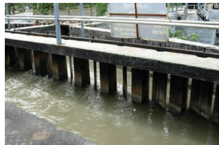
चित्र 18.4 ग्रिट और बालू अलग करने की टंकी