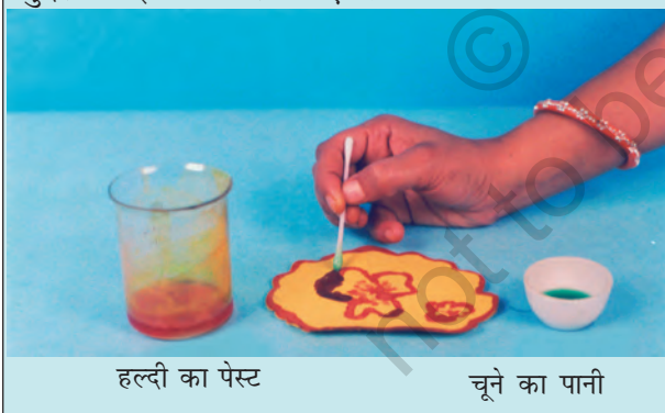
हल्दी का पेस्ट

आप अपनी माताजी के जन्मदिन पर, उनके लिए विशेष बधाई पत्र बना सकते हैं। सादे सफेद कागज़ की शीट पर हल्दी का पेस्ट लगाइए और उसे सुखा लीजिए। रुई के फाहे की सहायता से इस पर चूने के पानी से एक खूबसूरत फूल बनाइए। आपको एक सुंदर बधाई पत्र मिल जाएगा।