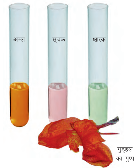
चित्र 5.3 गुड़हल का पुष्प और उससे तैयार किया गया सूचक

आप इन प्राकृतिक सूचकों को बनाकर उनसे अम्लीय, क्षारकीय और उदासीन विलयनों में रंग परिवर्तन देखने का प्रयास कर सकते हैं।