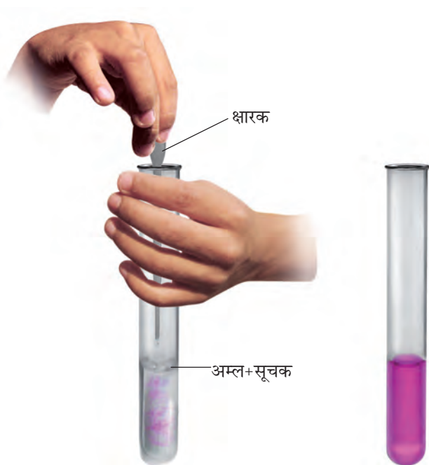
चित्र 5.4 उदासीनीकरण का प्रक्रम

(चित्र 5.4)। परखनली को धीरे-धीरे हिलाइए। क्या आपको अम्ल के रंग में कोई परिवर्तन दिखाई देता है?