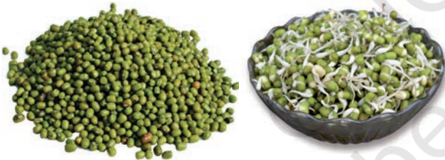
चित्र 1.5 साबुत मूँग एवं अंकुरित मूँग

मूँग अथवा चने के कुछ सूखे बीज लीजिए। अब इनमें से कुछ बीजों को जल से भरे एक पात्र में डाल दें तथा एक दिन के लिए छोड़ दीजिए। अगले दिन जल को पूरी तरह निकाल दें और बीजों को गिलास में रहने दें। उन्हें एक गीले कपड़े में लपेटकर एक ओर रख दीजिए। अब क्या आप बीजों में कुछ परिवर्तन देखते हैं? क्या एक छोटी-सी सफ़ेद संरचना