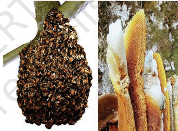
चित्र 1.7 मधुमक्खी का छत्ता

क्या आप जानते हैं कि शहद कहाँ से आता है या यह कैसे उत्पादित होता है? क्या आपने एक मधुमक्खी का छत्ता देखा है, जहाँ बहुत-सी मधुमक्खियाँ भिनभिनाया करती हैं? मधुमक्खियाँ फूलों से मकरंद (मीठे रस) एकत्रित करती हैं और इसे अपने छत्ते में भंडारित करती हैं (चित्र 1.7)। फूल और उनका मकरंद, वर्ष के केवल कुछ समय में ही उपलब्ध होते हैं। अतः मधुमक्खियाँ