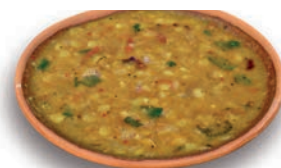
(a) कुछ पादप स्रोत

सारणी 1.2 में सूचीबद्ध कुछ कच्ची सामग्री जैसे फल और सब्जी के स्रोत का अनुमान लगाना हमारे लिए बहुत आसान हो सकता है (चित्र 1.2a)। यह कहाँ से आते हैं? निश्चित रूप से पौधों से। गेहूँ और चावल का क्या स्रोत है? आपने धान और गेहूँ के खेतों में उनके पौधों की अनेक पंक्तियाँ देखी होंगी। इनसे हमें अनाज प्राप्त होते हैं (चित्र 1.3)।