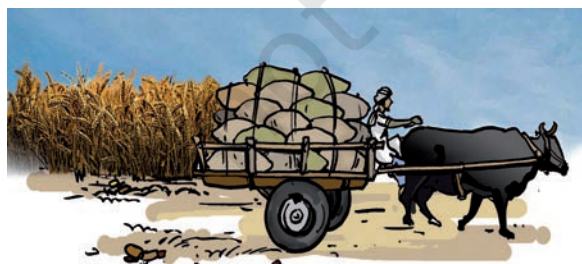
(b) गेहूँ का परिवहन