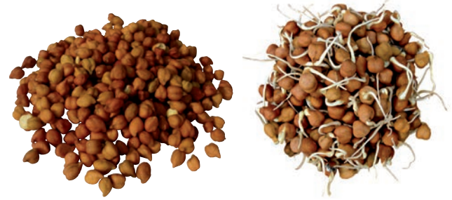
चित्र 1.6 चना एवं अंकुरित चना

अंकुरों को सावधानी से धोकर आप इन्हें खा सकते हैं। ये उबाले भी जा सकते हैं। इनमें कुछ मसाले मिलाने पर खाने के लिए एक स्वादिष्ट अल्पाहार तैयार हो जाता है।