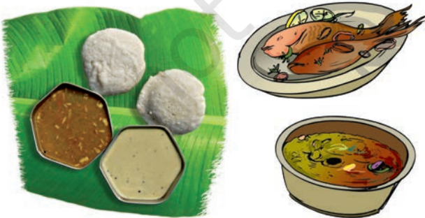
चित्र 1.1 विभिन्न खाद्य पदार्थ

अपने भोजन में हम अनेक प्रकार की चीजें खाते हैं (चित्र 1.1)। खाने की ये सभी चीजें किससे बनी हैं?