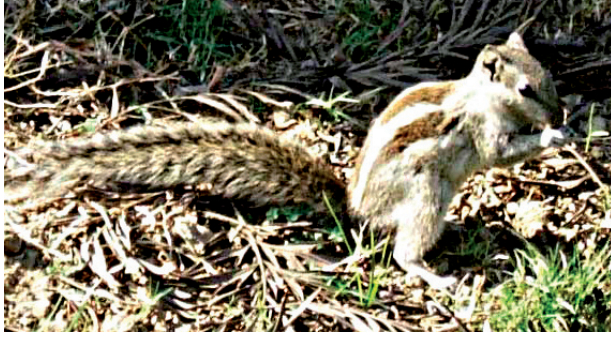
चित्र 1.8 गिलहरी अखरोट खाते हुए