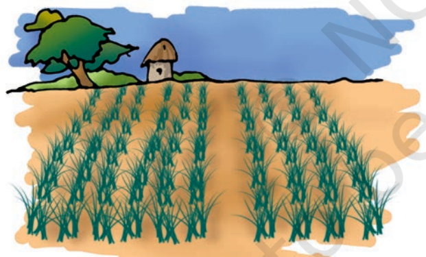
(a) धान का खेत

सारणी 1.2: खाद्य व्यंजन : संघटक जिससे वे बने हैं तथा उनके स्रोत