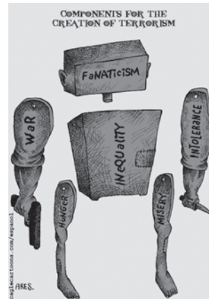
आतंकवाद के जन्म के कारण

संयुक्त राष्ट्र शैक्षणिक, वैज्ञानिक एवं सांस्कृतिक संगठन (यूनिसेफ) के संविधान ने उचित ही टिप्पणी की है कि, “चूँकि युद्ध का आरंभ