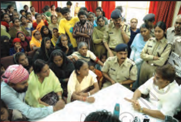
गैस राहत मंत्री से बात करते गैस पीड़ित।

सबूतों से पूरी तरह साफ़ था कि इस महाविनाश के लिए यूनिन कार्बाइड ही दोषी है, लेकिन कंपनी ने अपनी गलती मानने से इनकार कर दिया।