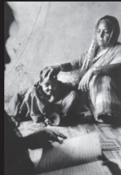
गैस से बुरी तरह प्रभावित एक बच्चा

जहरीली गैस के संपर्क में आने वाले ज्यादातर लोग गरीब कामकाजी परिवारों के लोग थे। उनमें से लगभग 50,000 लोग आज भी इतने बीमार हैं कि कुछ काम नहीं कर सकते। जो लोग इस गैस के असर में आने के बावजूद जिंदा रह गए उनमें से बहुत सारे लोग गंभीर श्वास विकारों, आँख की बीमारियों और अन्य समस्याओं से पीड़ित हैं। बच्चों में अजीबो-गरीब विकृतियाँ पैदा हो रही हैं। इस चित्र में दिखाई दे रही लड़की इस बात का उदाहरण है।