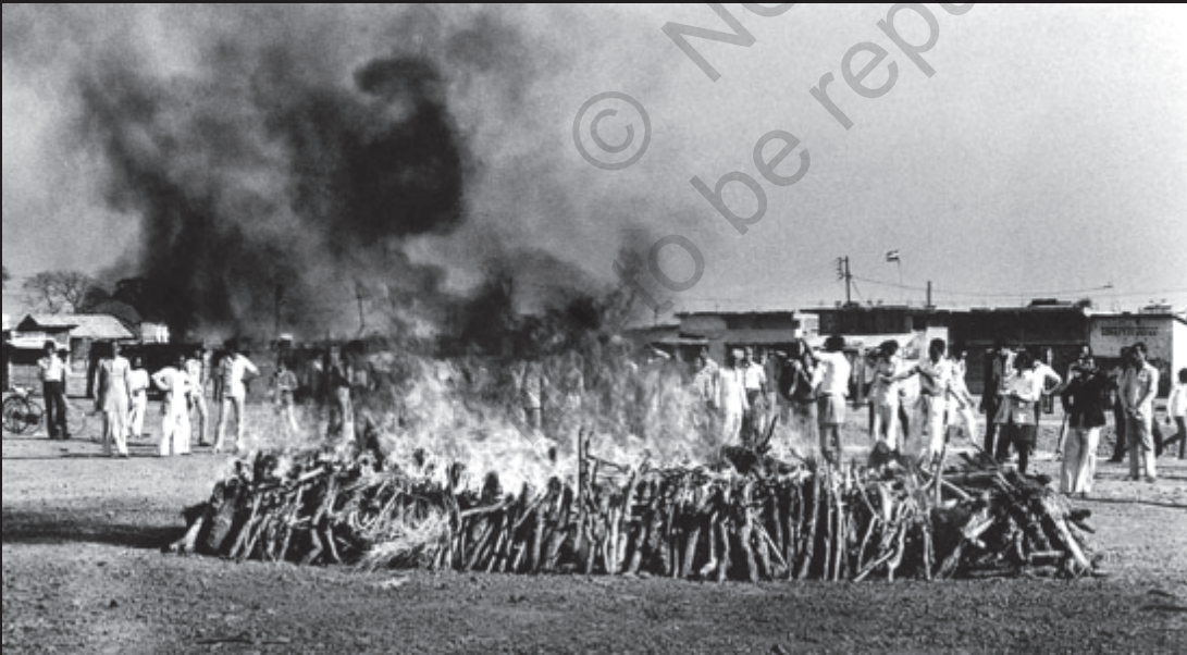
सामूहिक अंतिम संस्कार

तीन दिन के भीतर 8,000 से ज्यादा लोग मौत के मुँह में चले गए। लाखों लोग गंभीर रूप से प्रभावित हुए।