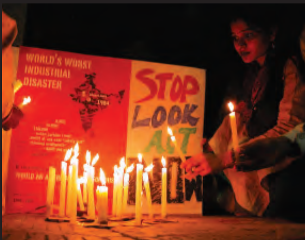
इंसाफ़ की लड़ाई अभी जारी है...।

24 साल बाद भी लोग न्याय के लिए संघर्ष कर रहे हैं। वे पीने के साफ़ पानी, स्वास्थ्य सुविधाओं और यूनिन कार्बाइड के जहर से ग्रस्त लोगों के लिए नौकरियों की माँग कर रहे हैं। उन्होंने यूनिन कार्बाइड के चेयरमैन एंडरसन को सज़ा दिलाने के लिए भी आंदोलन चलाया है।