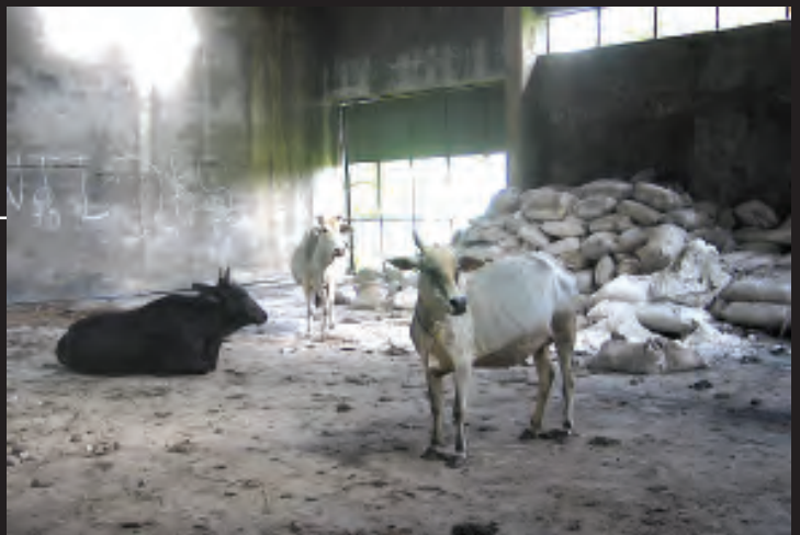
यूनिन कार्बाइड संयंत्र के इर्द-गिर्द बिखरे पड़े रसायनों के बोरे

यूनिन कार्बाइड ने कारखाना तो बंद कर दिया, लेकिन भारी मात्रा में विषैले रसायन वहीं छोड़ दिए। ये रसायन रिस-रिस कर ज़मीन में जा रहे हैं जिससे वहाँ का पानी दूषित हो रहा है। अब यह संयंत्र डाओ कैमिकल नामक कंपनी के कब्जे में है जो इसकी साफ़-सफ़ाई का जिम्मा उठाने को तैयार नहीं है।