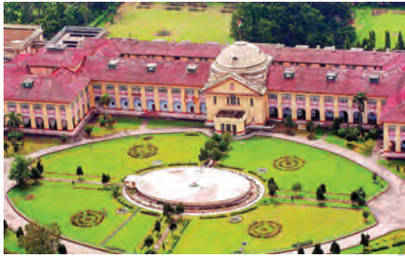
पटना उच्च न्यायालय

क्या विभिन्न स्तरों की ये अदालतें एक-दूसरे से जुड़ी हुई हैं? जी हाँ। भारत में हमारे पास एकीकृत न्यायिक व्यवस्था है। इसका मतलब यह है कि ऊपरी अदालतों के फैसले नीचे की सारी अदालतों को मानने होते हैं। इस एकीकरण को समझने के लिए अपील की व्यवस्था को देखा जा सकता है। अगर किसी व्यक्ति को ऐसा लगता है कि निचली अदालत द्वारा दिया गया फैसला सही नहीं है, तो वह उससे ऊपर की अदालत में अपील कर सकता है।