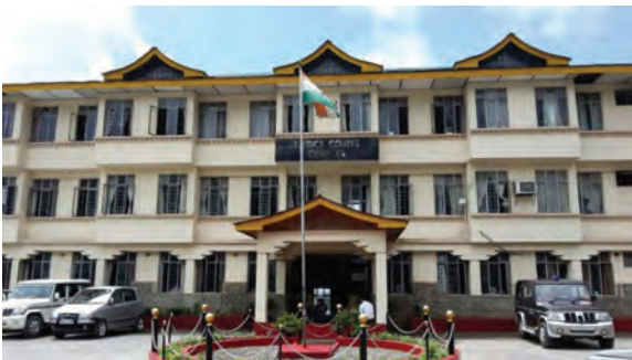
नामची, दक्षिण सिक्किम में ज़िला अदालत