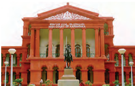
कर्नाटक उच्च न्यायालय