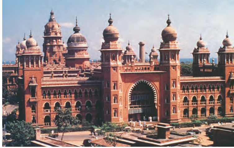
मद्रास उच्च न्यायालय

उच्च न्यायालयों की स्थापना सबसे पहले 1862 में कलकत्ता, बंबई और मद्रास में की गई ये तीनों प्रेसिडेंसी शहर थे। दिल्ली उच्च न्यायालय का गठन 1966 में हुआ। आज देश भर में 25 उच्च न्यायालय हैं। बहुत सारे राज्यों के अपने उच्च न्यायालय हैं जबकि पंजाब और हरियाणा का एक साझा उच्च न्यायालय चंडीगढ़ में है। दूसरी तरफ चार पूर्वोत्तर राज्यों असम, नागालैंड, मिजोरम और अरुणाचल प्रदेश के लिए गुवाहाटी में एक ही उच्च न्यायालय रखा गया है। 1 जनवरी 2019 से आंध्र प्रदेश (अमरावती) और तेलंगाणा (हैदराबाद) में अलग-अलग उच्च न्यायालय हैं। ज्यादा से ज्यादा लोगों के नज़दीक पहुँचने के लिए कुछ उच्च न्यायालयों की राज्य के अन्य हिस्सों में खण्डपीठ (बेंच) भी हैं।