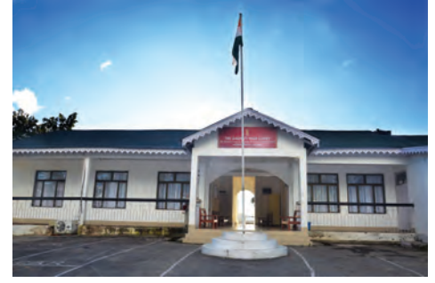
गुवाहाटी उच्च न्यायालय का अड़ज़ोल (मिज़ोरम) बेंच http://ghcazlbench.nic.in

उपरोक्त मामले को पढ़ने के बाद दो वाक्यों में लिखिए कि अपील की व्यवस्था के बारे में आप क्या जानते हैं।