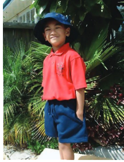
कक्षा सात का एक सामोआ छात्र अपने विद्यालय की वदी में।

कक्षा 6 में आने के बाद लड़के और लड़कियाँ अलग-अलग स्कूलों में जाते थे। लड़कियों के स्कूल, लड़कों के स्कूल से बिलकुल