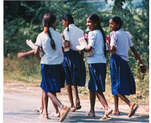
लड़कियाँ स्कूल जाते हुए समूह बनाकर चलना क्यों पसंद करती हैं?

आपके बड़े होने के अनुभव, सामोआ के बच्चों और किशोरों के अनुभव से किस प्रकार भिन्न हैं? इन अनुभवों में वर्णित क्या कोई ऐसी बात है, जिसे आप अपने बड़े होने के अनुभव में शामिल करना चाहेंगे?